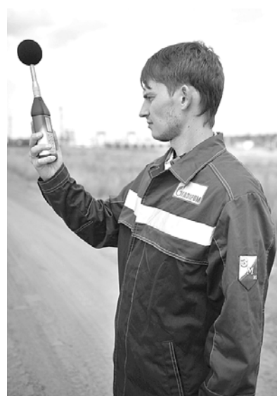
Замер уровня шума.

ных и недостаточно очищенных сточных вод; на 5,9% снижена доля направляемых на захоронение отходов; на 3,9% снижен объём водопотребления из подземных источников. Была продолжена работа по установлению плановых экологических показателей для филиалов, что послужило стимулом к достижению ими экологических целей.