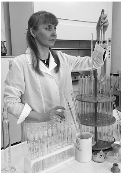
Лабораторные исследования качества воды.

В период с 2006 по 2010 гг. в Обществе была успешно реализована программа строительства в филиалах автомоек с оборотным водоснабжением, позволяющих существенно сократить потребление воды и снизить негативное воздействие на окружающую среду.