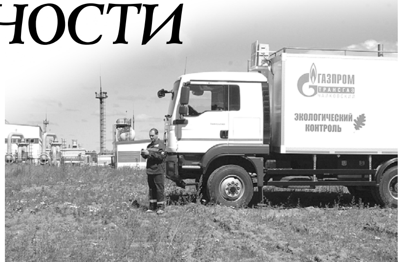
Передвижная экологическая лаборатория.

ных и недостаточно очищенных сточных вод; на 5,9% снижена доля направляемых на захоронение отходов; на 3,9% снижен объём водопотребления из подземных источников. Была продолжена работа по установлению плановых экологических показателей для филиалов, что послужило стимулом к достижению ими экологических целей.