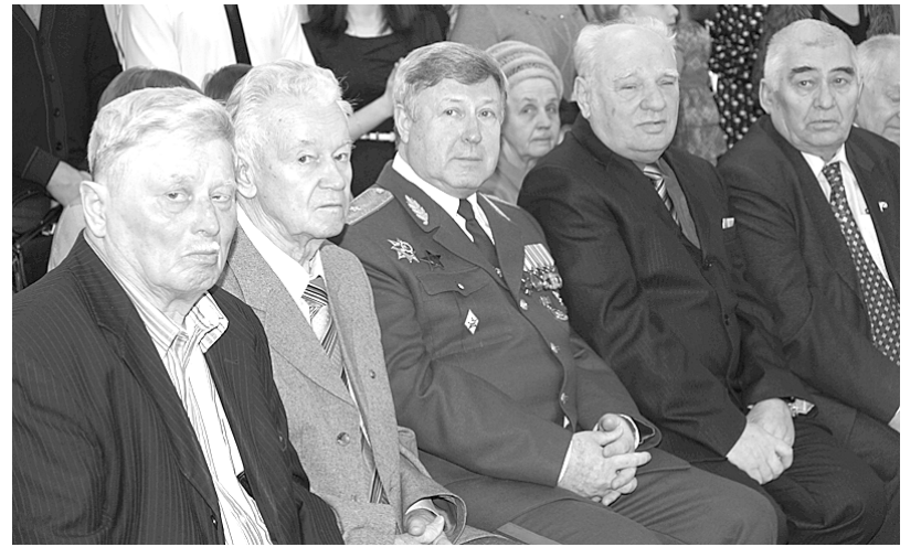
Почётные гости выставки.

Всего экспонируется более 300 предметов, документов и фотографий, большая часть которых подлинники. Впервые выставлены личные вещи: гвардии генерал-лейтенанта танковых войск, первого командира 10-го гвардейского УЛДТК