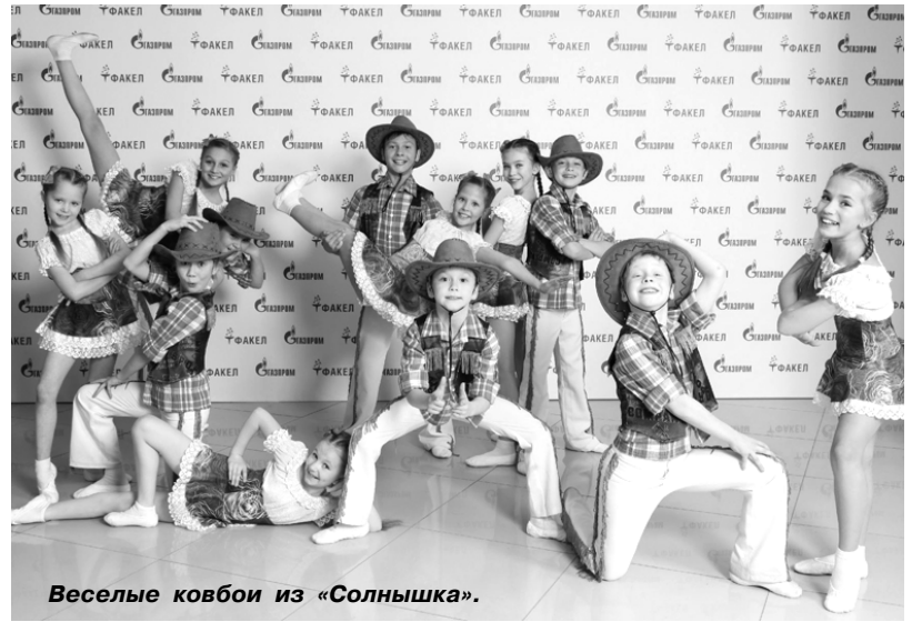
Веселые ковбои из «Солнышка».

нова великолепно исполнила «Чардаш», имитируя голосом звуки музыкальных инструментов, и заняла второе место в номинации «Эстрадный вокал, соло».