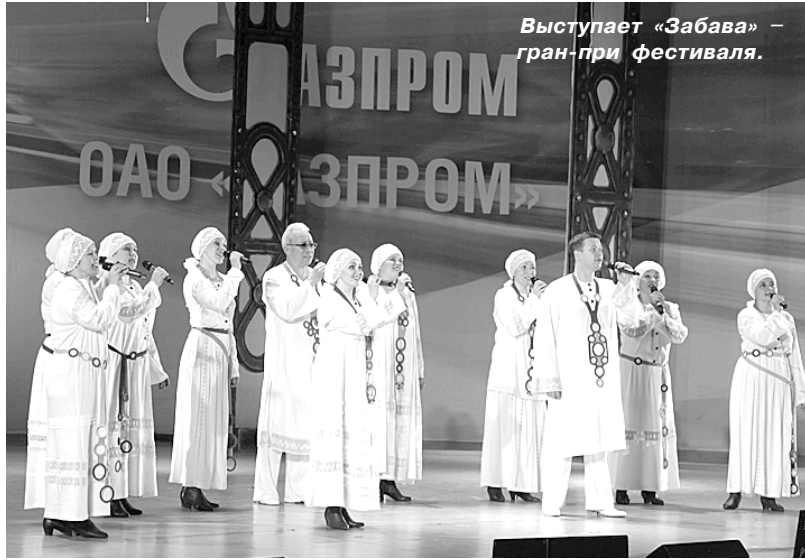
Выступает «Забава» – гран-при фестиваля.