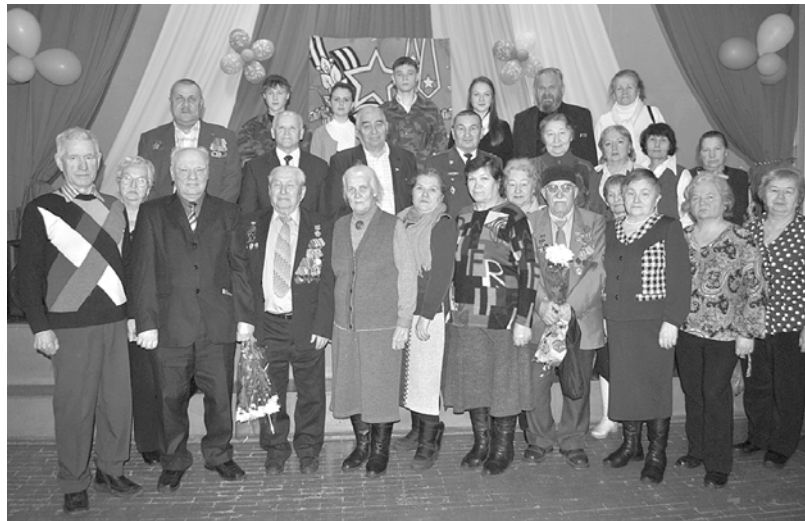
Встречи трёх поколений.

К юбилейной дате сражения в актовом зале городской школы №8 отметили День воинской славы. Здесь встретились три поколения чайковцев. Организаторами встречи стали совет ветеранов муниципального района и руководство школы. Школьникам представилась возможность узнать о реальных событиях, фактах, о том, как разворачивались военные действия под Сталинградом. Почетными гостями встречи стали ветераны Великой Отечественной, Чеченской и Афганской войн. В нашем городе живут