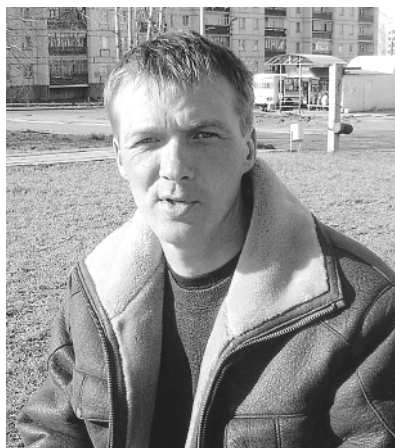
Из малиновой тетради

Кто видел рисунки линий И шрамов моей руки, Тот знает о тайне лилий, Белеющих среди реки. А в их лепестковом свете, Поверьте, не мало тайн... Вы, кстати, ладонь поэта Не видели невзначай? Ладонь я не раскрываю, Повсюду перо держу. Раскроешь – и вязь такая! Сегодня не покажу.