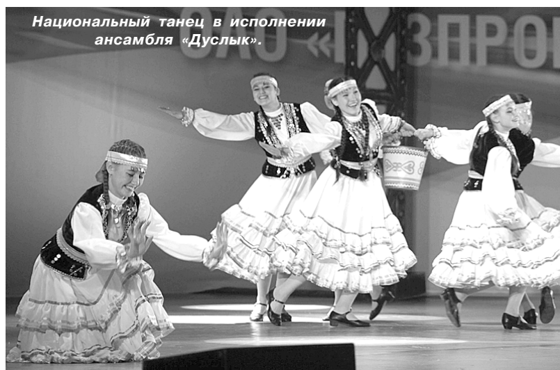
Национальный танец в исполнении ансамбля «Дуслык».

Коллективы до последнего момента не знали результатов своих выступлений. После третьего конкурсного дня руководителям творческих делегаций был оглашён список кол-