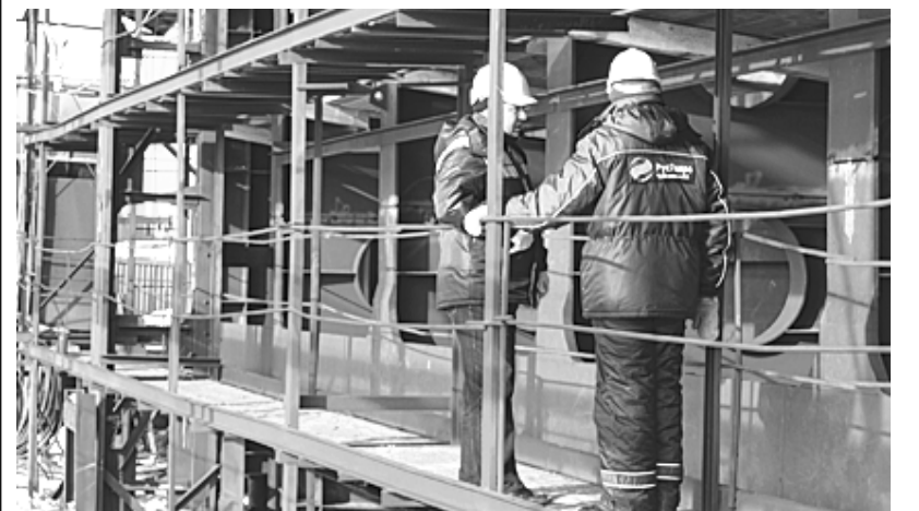
Сборка новых затворов идет на монтажной площадке водосливной плотины Воткинской ГЭС.