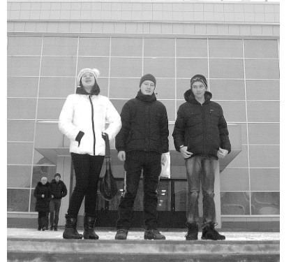
ДВОРЕЦ МОЛОДЕЖИ города Перми