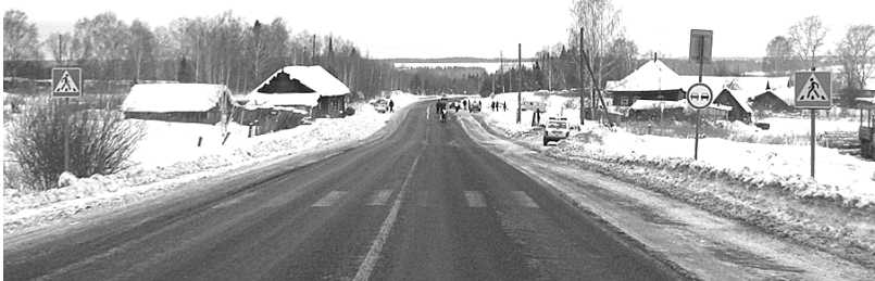
Переходи улицу в установленном месте – оградишь себя от бед и несчастий.

Администрация Чайковского муниципального района (комитет по управлению имуществом) информирует население о: – предоставлении земельных участков для целей, связанных со строительством, в соответствии со ст. 31 Земельного кодекса РФ: