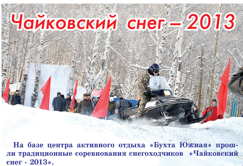
На базе центра активного отдыха «Бухта Южная» прошли традиционные соревнования снегоходчиков «Чайковский снег - 2013».

18.00, холл гостиницы «Снежинка» – Церемония награждения.