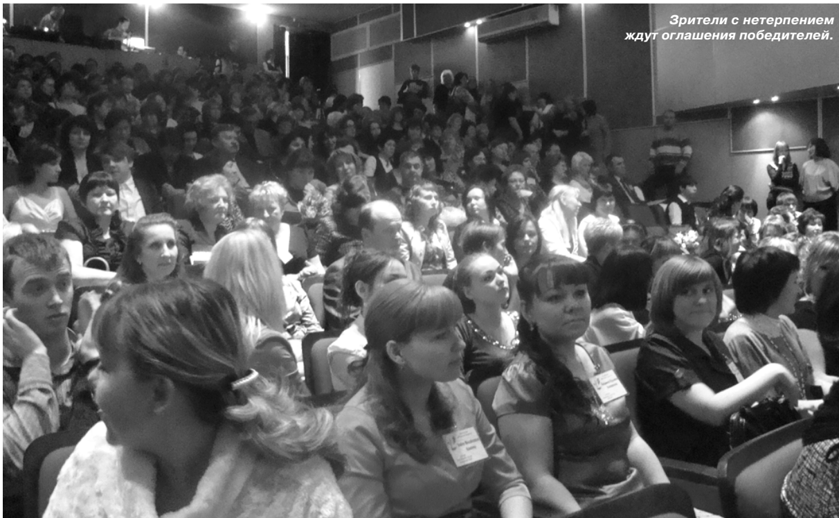
Зрители с нетерпением ждут оглашения победителей.