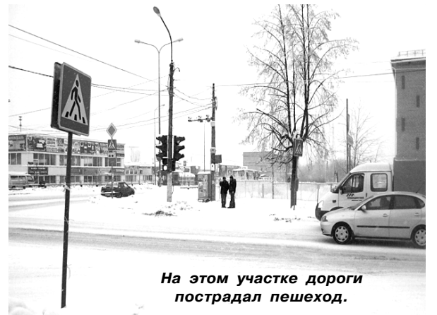
На этом участке дороги пострадал пешеход.

19 января в 12.00 часов по Приморскому бульвару со стороны ул. Промышленная двигался автомобиль УАЗ, под колеса которого в районе дома №61 по Приморскому бульвару попал 72-летний мужчина-пешеход. Как выяснилось, последний переходил проезжую часть по пешеходному переходу на разрешающий сигнал светофора. В результате ДТП он получил теле-