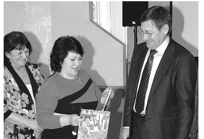
Поздравление от председателей микрорайонов.