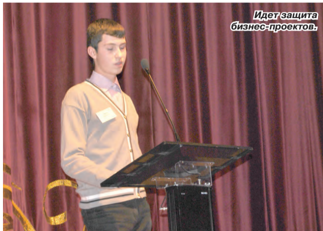
Идет защита бизнес-проектов.

Кто будет решать проблемы, навсегда останется с проблемами. Кто будет реализовывать возможности, тот покорит мир. Справедливое замечание, если учесть, что больше всего возможностей у молодых: перед ними открыты дороги, им строить будущее государства и жить в нём. Молодёжный инновационный форум Пермского края, состоявшийся в Чайковском 7 декабря, собрал самых ярких представителей поколения NEXT. Как уже писали «Огни Камы», участие в форуме приняли 22 делегации из Пермского края, республик Удмуртия и Татарстан – всего более полутысячи человек.