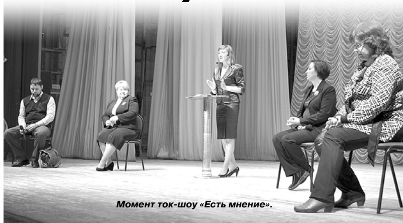
Момент ток-шоу «Есть мнение».

– Никогда не увлекайтесь крупнобюджетными идеями, тогда больше вероятности, что весь пар уйдет в