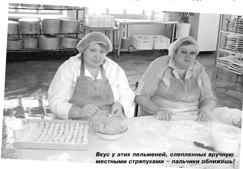
Вкус у этих пельменей, слепленных вручную местными стряпухами – пальчики оближешь!

нитарным нормам, 100-процентной «охлажденкой» считается куриное мясо со сроком годности 72 часа – с момента забоя птицы. С большим трудом верится, что до чайковских супермаркетов мясо дойдёт за этот срок? Скорее всего, его везут за-