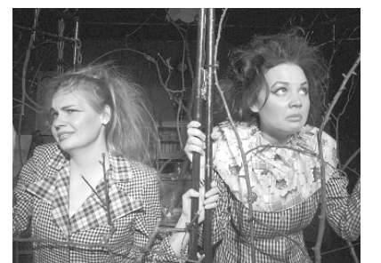
Сцена из спектакля «Женитьба Бальзамина».