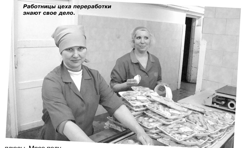
Работницы цеха переработки знают свое дело.

Слава Богу, подобный голодомор не грозит поголовью нашей птицы. И, прежде всего, потому, что у птицефабрики «Чайковская» есть надежный буфер – своя кормовая база. Взяв курс на улучшение плодородия почв и культуру земледелия, из года в год полеводы предприятия нара-