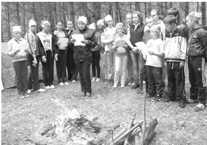
22 сентября состоялось итоговое мероприятие в рамках проекта «Большое приключение».

ковском прошел семинар по теме «Повышение эффективности семейного воспитания средствами туризма». По итогам мероприятия образовательные учреждения Чайковс-