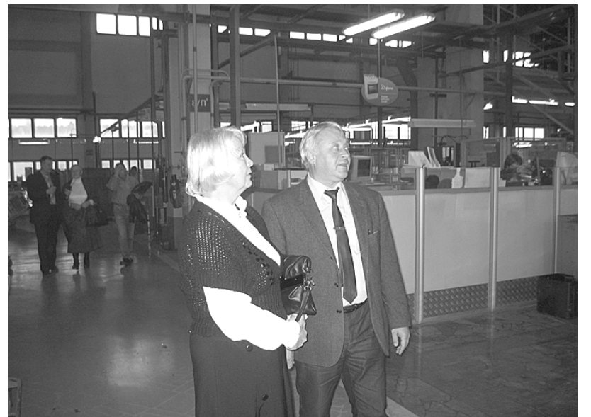
Бывшие сотрудники ЗГА прошлись по родным цехам.