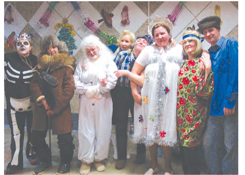
Артисты театра миниатюр «Шалопай» перед очередным выступлением.

В репертуаре «Шалопай» множество миниатюр на тему села, всевозможных российских праздников и значимых