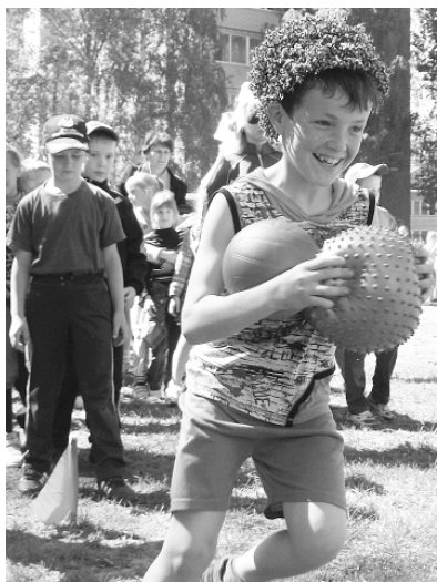
В летние каникулы дети с радостью принимали участие в туристско-спортивных праздниках.