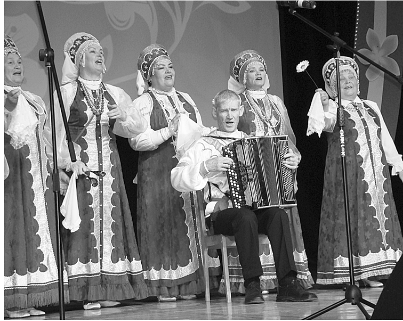
Выступает ансамбль русской песни «Прялица», победитель конкурса художественной самодеятельности.

ходили тысячи метров нашей чайковской ткани, именно вы возводили корпуса заводов СК и «Точмаш», именно вы закладывали традиции и формировали культуру нашего города. Вы и сегодня продолжаете активную общественную деятельность.