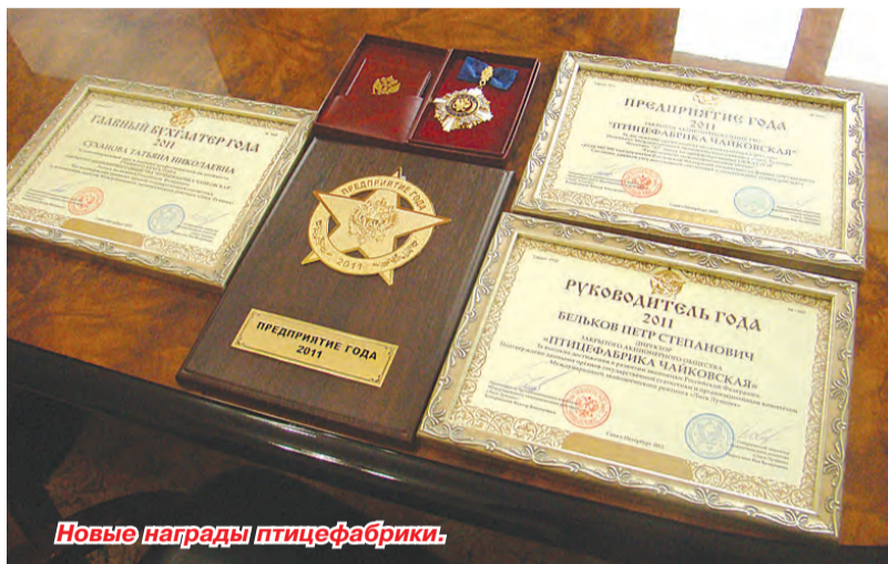
Новые награды птицефабрики.