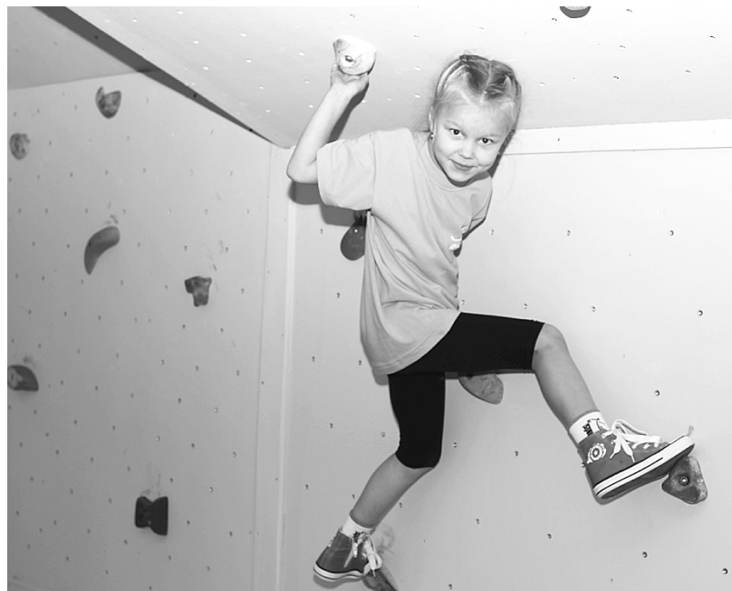
Бouldеринговый зал – отличное место для активного отдыха взрослых и детей.