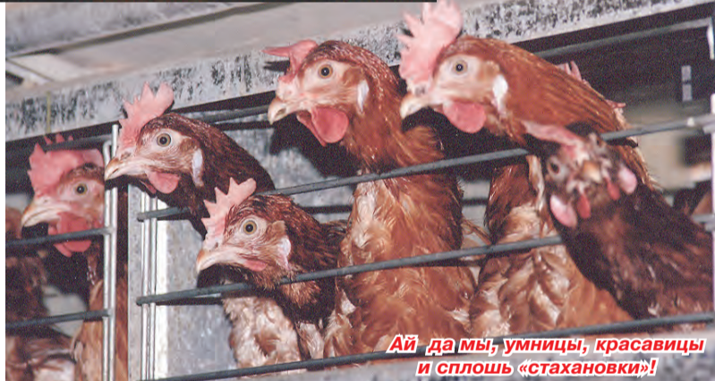
Ай да мы, умницы, красавицы и сплошь «стахановки»!

мотные, профессионально подготовленные, почти 70 человек у нас имеют высшее образование и столько же – со средне-техническим. Несколько представителей нашего коллектива имеют звания заслуженных работников сельского хозяйства, например, заслуженный агроном, заслуженный механизатор, заслуженный зоотехник и т.д. Тридцать человек отмече-