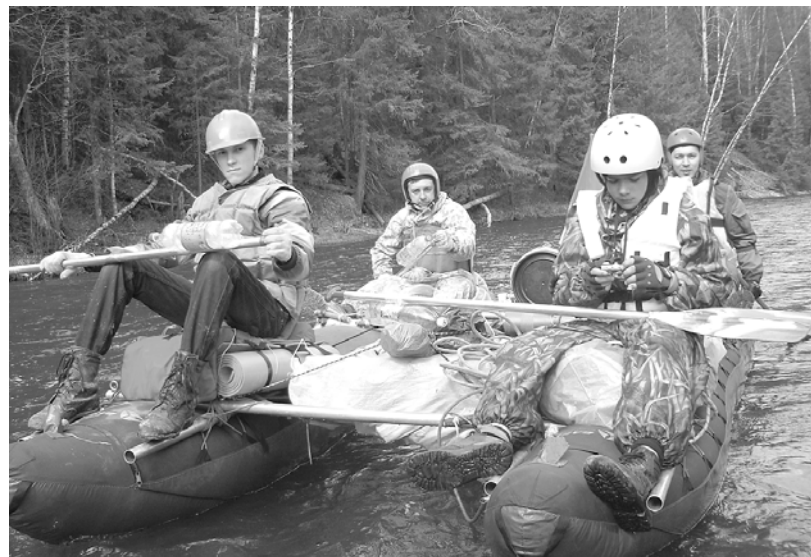
Сплав по реке Вижай.