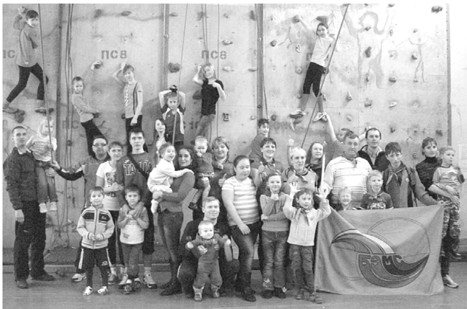
Семейный клуб станет проводить занятия в бouldеринговом зале.

В результате реализации лукойловского проекта на базе станции была создана новая коммуникатив-