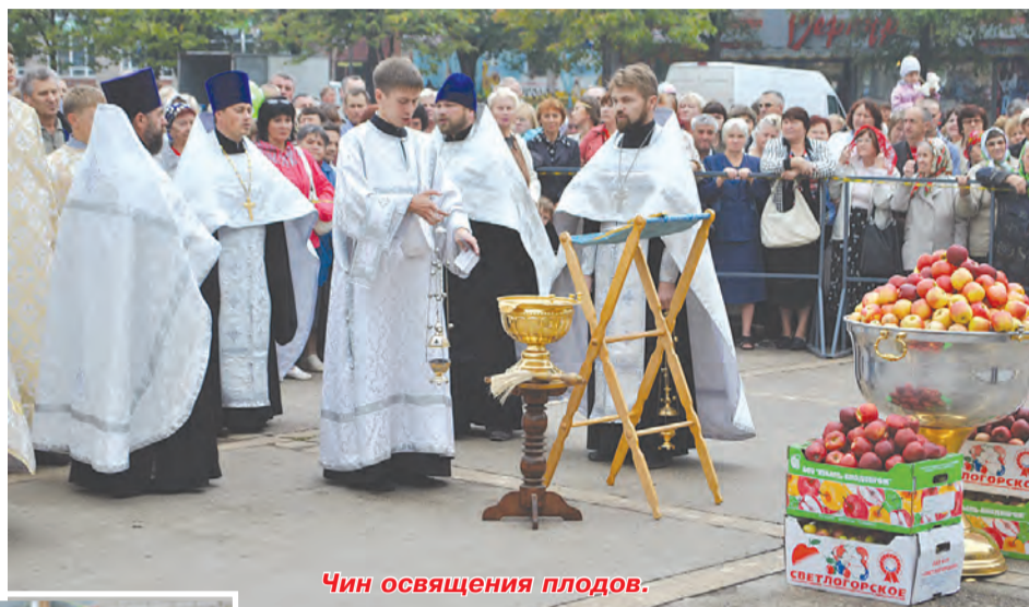
Чин освящения плодов.