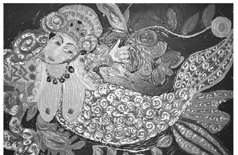
«Царица морская». Нина Гелинг. Акрил. Холст.

– Эта выставка связана с древней мифологией, здесь присутствуют легенды древнего Урала, в работах отразился пермский звериный стиль. Художники с головой ушли в этот загадочный и очень сложный мир, где ищут истину. Эта выставка заставляет зрителя думать,