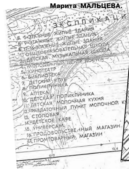
План детальной планировки 1988 года.

расти и развиваться, в котором появляются новые социальные объекты. И в этом большая заслуга действующей администрации города.