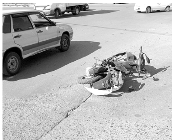
7 августа. ДТП с участием скутеристов продолжаются.

12-16 сентября 2012 года Выставочный центр «Пермская ярмарка», проводит 4-ю межрегиональную выставку-ярмарку сельскохозяйственной продукции, садового инвентаря, семян, саженцев и кустарников, а также товаров и услуг для обустройства садовых участков в осенний период «ОСЕННИЙ САД И ОГОРОД»