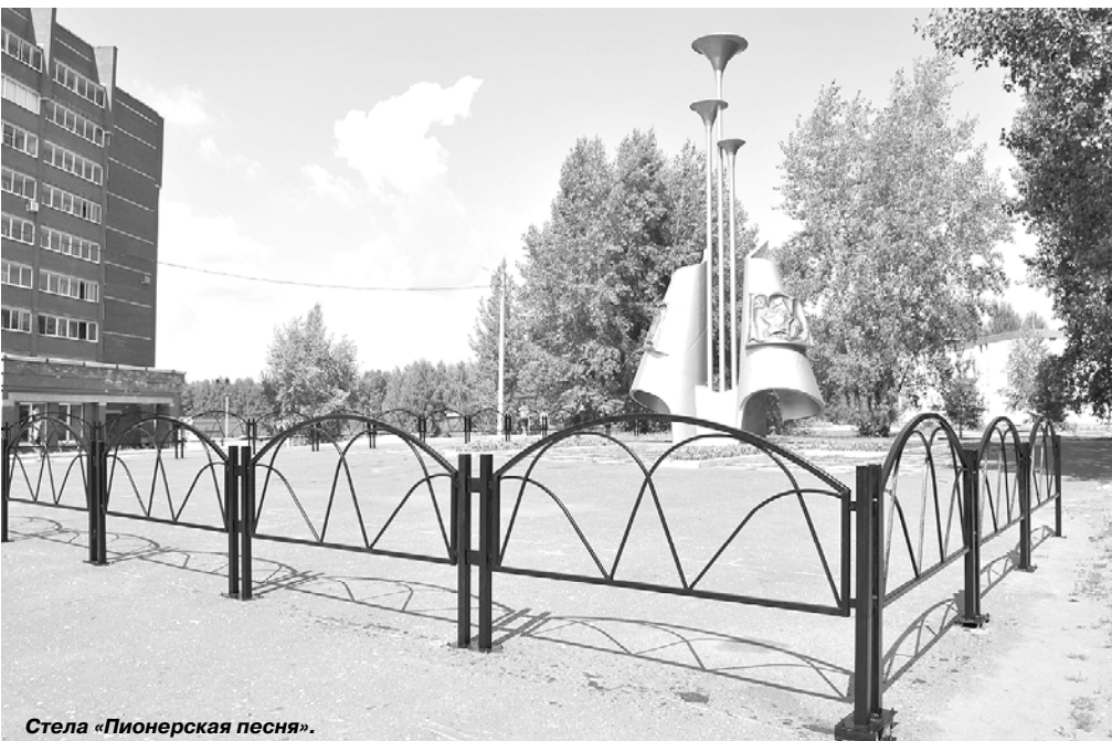
Стела «Пионерская песня».