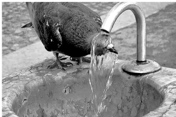
Птицы не люди – а туда же.