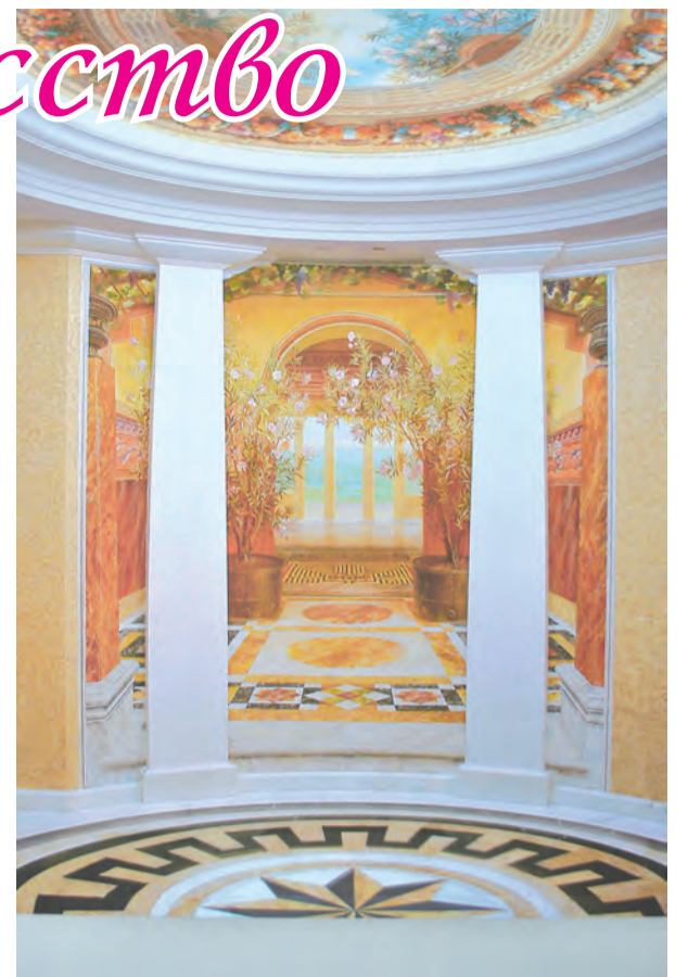
«Римский дворик». Автор А.В. Шевардин.