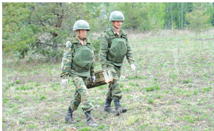
Переноска боеприпасов на полигоне.