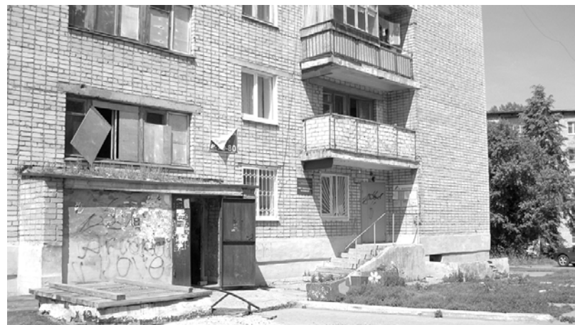
Без клумбы территория у дома выглядела уныло и скучно.