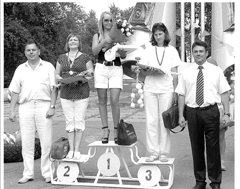
Победительницы соревнования «Авто-РОЗА».

– Вечерние мероприятия понравились своей зажигательностью. Запомнились выступления артистов из Тольятти и Перми. Да и наши доморощенные коллективы ничем не уступают московским звездам. Еще здорово, что в этом году празднование длилось три дня. Отдыхать вообще хорошо, а всем городом – вдвойне приятней.