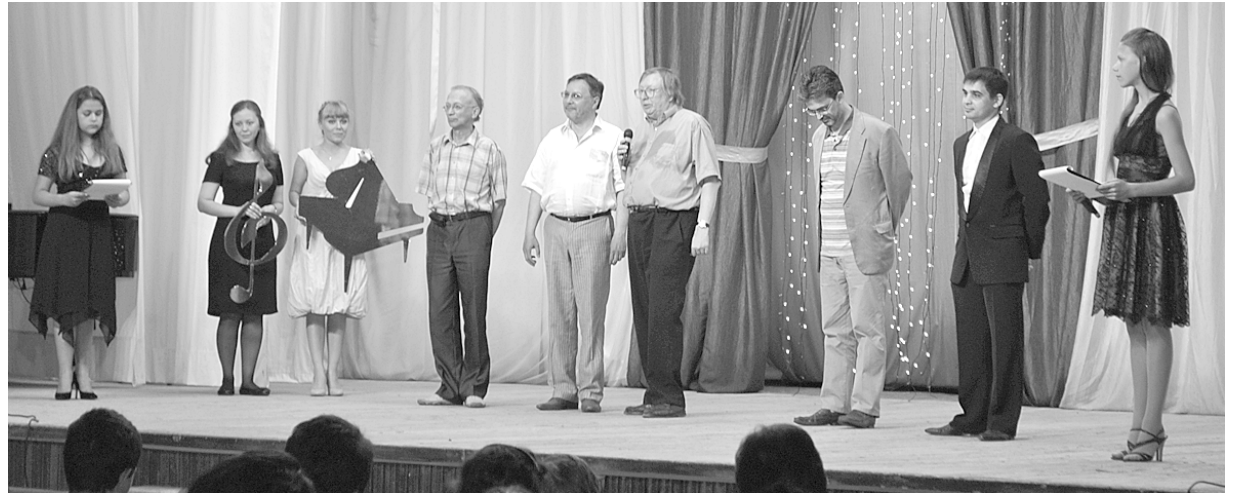
Концертный зал музыкального училища. Открытие конкурса.