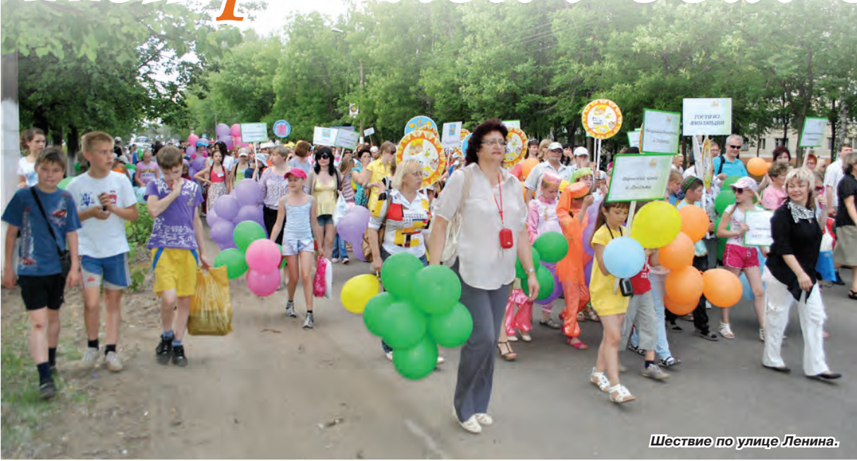
Шествие по улице Ленина.