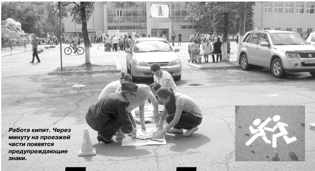
Работа кипит. Через минуту на проезжей части появятся предупреждающие знаки.