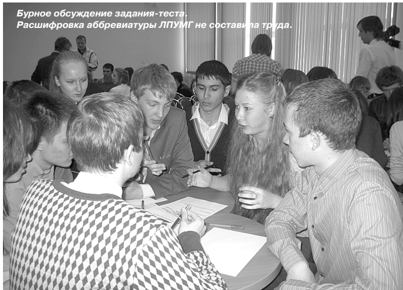
Бурное обсуждение задания-теста. Расшифровка аббревиатуры ЛПУИГ не составила труда.

Выбор будущей профессии – занятие не из простых. Если ты с детства мечтаешь стать врачом или капитаном дальнего плавания и, становясь старше, мечтам своим не изменил, – ты счастливчик. Потому как многие ребята совершенно не представляют себе «кем быть» и куда поступать, когда прозвенел последний школьный звонок. Хорошо, если проблема выбора тревожит современных школьников по-настоящему, – это означает, что произошло созревание в социальном и психологическом плане. Хуже, если старшекласснику пока все равно: мама за руку отведет в юридический институт (потому что ребенку «как бы нравится история»), а потом окажется, что он терпеть не может перебирать нудные бумажки и общаться с людьми.