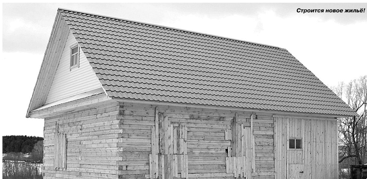
Строится новое жильё!