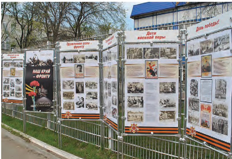
Выставка «Наш край – фронт».