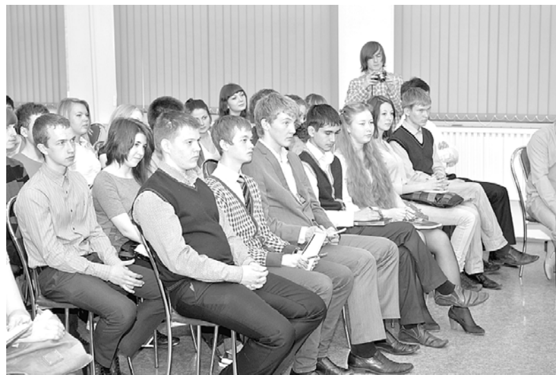
Вниманию школьников фильм «Путешествие по газовой реке Прикамья».

диалог между старшеклассниками и газовиками, основанный на вопросах и ответах.