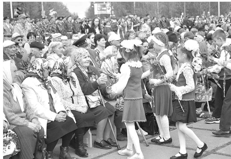
Несмотря на волнение, помощь не понадобилась.

Сотрудники «скорой помощи» желают всем жителям города и района крепкого здоровья, быть предельно внимательными и осторожными в любых ситуациях, беречь себя и своих близких.