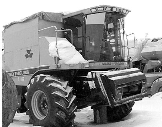
Американский комбайн «Фергюзон».