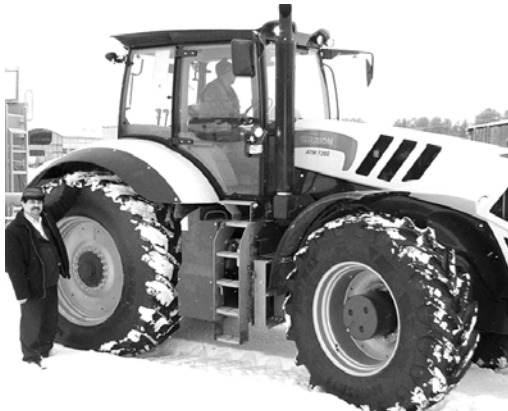
Новый супер-трактор «Терион».