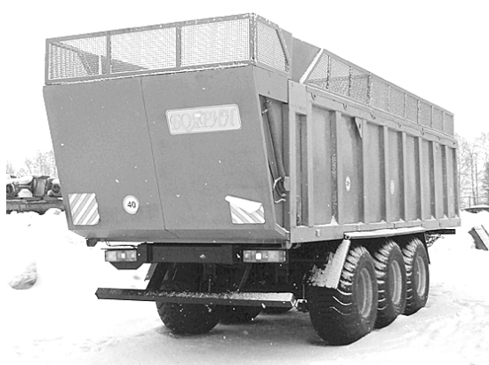
30-тонный прицеп «Боярин».