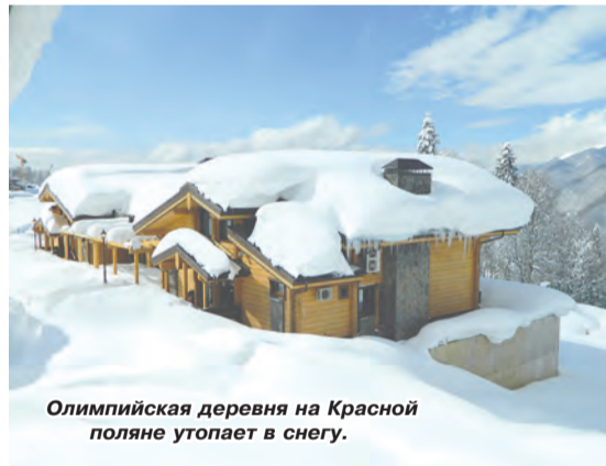
Олимпийская деревня на Красной поляне утопает в снегу.

Олимпийская деревня – это двадцать восемь комфортабельных пятикомнатных деревянных домов, рассчитанных на десять человек каждый: подогреваемые