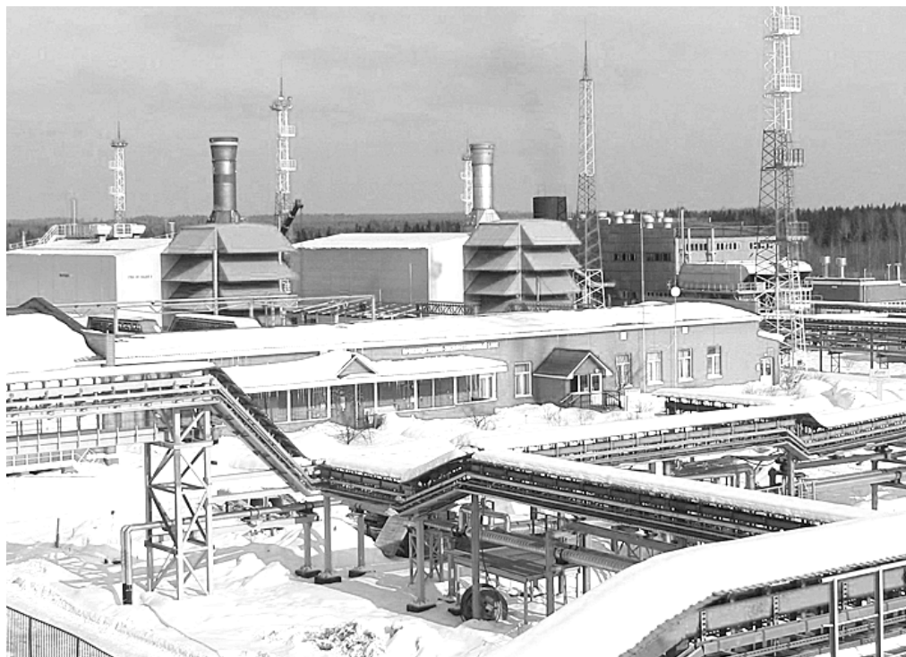
ГПА-32 «Ладога» на КС «Вавожская».