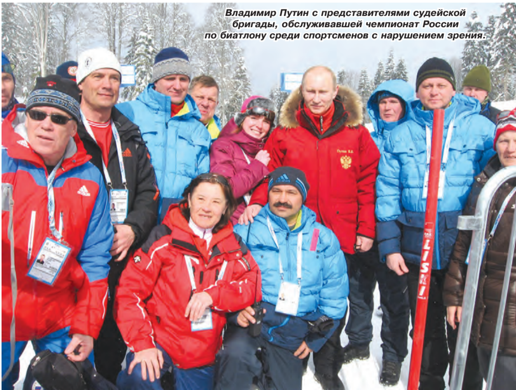
Владимир Путин с представителями судейской бригады, обслуживавшей чемпионат России по биатлону среди спортсменов с нарушением зрения.

Интересно было всё: проживание в олимпийской деревне на высоте 1500 метров над уровнем моря, уникальная спортивная база компании «Газпром» с множеством горнолыжных трасс, великолепный сервис... и восхитительная природа: заснеженные горные вершины, то сверкающие под лучами яркого солнца на фоне синего-синего неба, то тающие в призрачной дымке серебристых облаков.