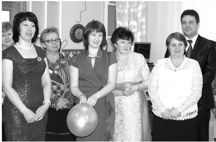
Глава города вместе с сотрудниками д/с №37 участвовал в конкурсах.