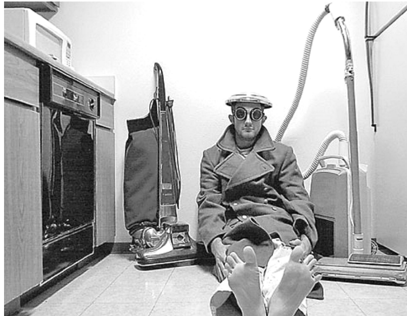
Прежде чем купить – сто раз подумай.

Итак, борьба «кто кого» началась. Пропылесосив участок ковра, раз тридцать старым пылесосом, иллюзионист победно провел по нему пару раз своим чудовищем и... что это! На девственно чистом фильтре словно по волшебству образовалась кучка мусора. Как так! Не может быть! – читалось в глазах обезумевших хозяев, имеющих репутацию отменных чистюль. А дальнейшее продолжение презентации их повергло в настоящий шок. Гость программы профессиональным движением менял один фильтр за другим, собирая пыль с дивана, кресел, ковра и демонстративно кидал на пол использованные фильтры, всем видом намекая на недопустимость жить в