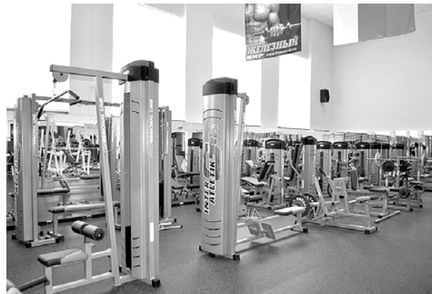
Спортивный зал оборудован профессиональными тренажерами.