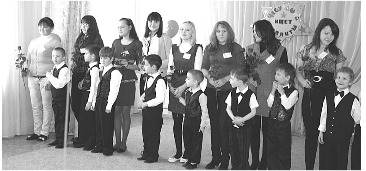
Второй этап конкурса профмастерства «Чебурашка ищет таланты».

В 2011 году, когда начали реализацию нашего проекта, мы провели классный час в педколледже на тему «Мифы и реальность профессии «Воспитатель». Несмотря на невысокооплачиваемую профессию, в работе воспитателя есть свои бонусы. Когда мы познакомили студентов с работой в нашем детском саду,