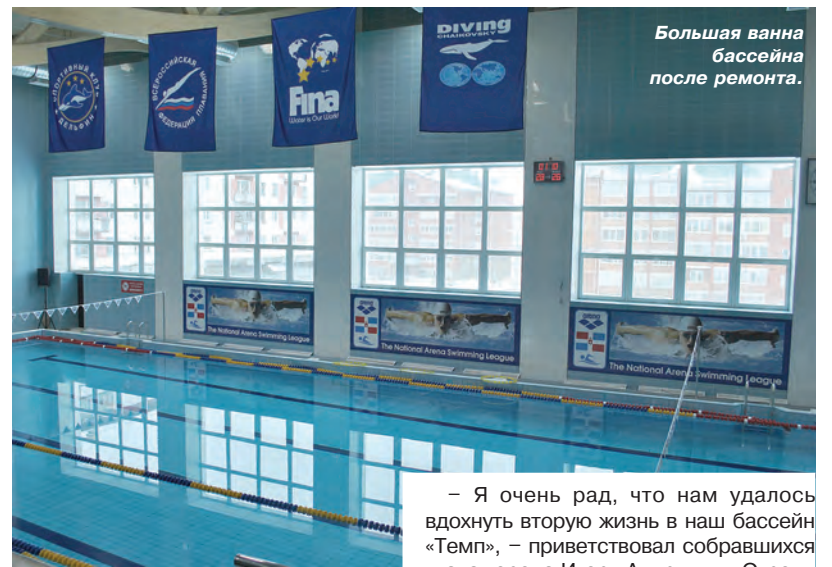
Большая ванна бассейна после ремонта.

В этот день у дверей «Темпа» собрались все, кто неравнодушен к спорту и здоровому образу жизни, жители микрорайона «Завокзальный» и всего города от мала до велика. И конечно же, среди приглашенных гостей – первые лица не только Чайковского района, но и всего Пермского края. Напомним, что проведение реконструкции бассейна стало возможным, благодаря участию города в реализации приоритетного регионального проекта «Приведение в нормативное состояние объектов социальной сферы».