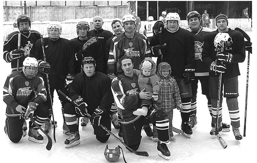
Чайковская команда хоккеистов-любителей «ЕРМАК и К.».

Можно уверенно утверждать, что следующий хоккейный сезон в Чайковском значительно расширит свою географию и состав хоккейных команд различного уровня, постепенно превращая хоккей из элитарного в массовый вид спорта. В нынешнем сезоне достаточно активно проявила себя группа чайковских хоккеистов-любителей, в конце концов, сформировавшаяся в команду с названием «ЕРМАК и К.». Компания получилась самая титулованная в городе, наполовину состоящая из тренеров, чем-