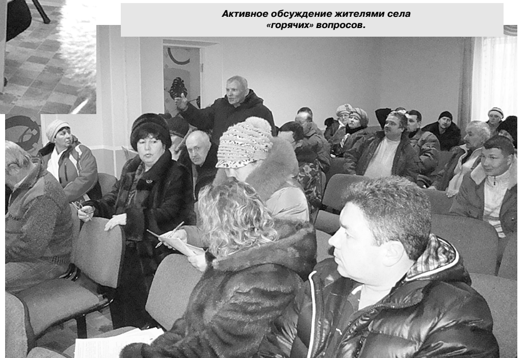
Активное обсуждение жителями села «горячих» вопросов.

Надо отдать должное жителям Ольховки, они активны и инициативны, и больше всего их волнует, конечно же, проблемы своего села. Пассивность