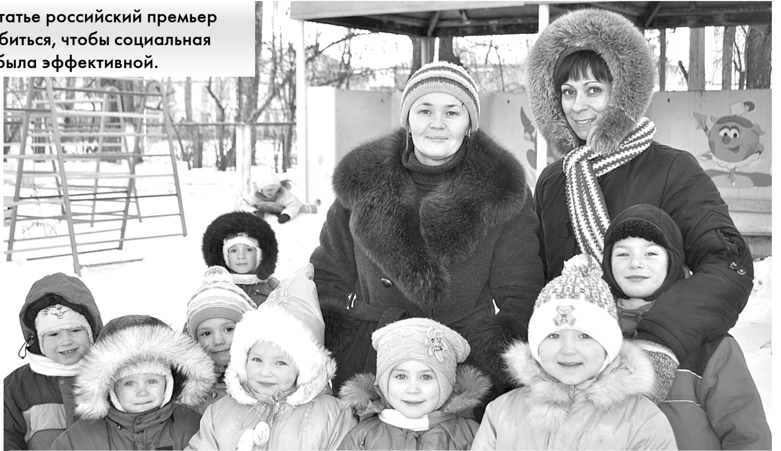
Детский сад № 4 – один из крупнейших в Чайковском муниципальном районе. Постоянно здесь функционируют 10 групп. Ежегодно из стен садика выпускаются более 60 детей, а это практически три будущих первых класса! К тому же четвертый детский сад чуть ли не единственный на нашей территории, где есть специальные логопедические группы.

Также, по словам Путина, «с 1 сентября 2012 года будет повышена оплата труда преподавателей государственных вузов – до размера средней зарплаты по региону». А в период до 2018 года она постепенно увеличится в 2 раза и тоже достигнет 200% от средней по экономике. При