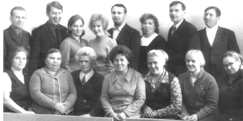
1973 год. Состав Чайковского городского суда.

Работу судей можно смело назвать опасной. Зачастую заседание суда превращается в столкновение интересов, и не все граждане ведут себя адекватно: плачут, ругаются, пытаются спровоцировать конфликт. Нередко летят в адрес судей угрозы и оскорбления. Так происходит и в наши дни, так было и полвека назад.