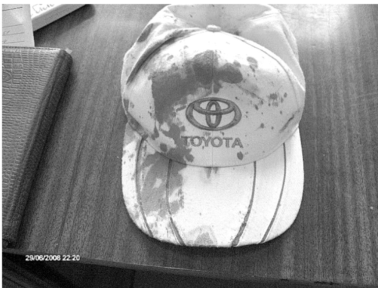
Найденная на месте преступления бейсболка явилась главной уликой.