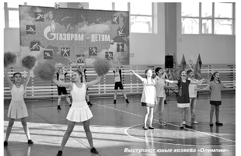
Выступают юные хозяйки «Олимпии».