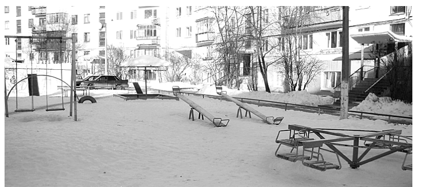
Площадке во дворе дома по ул. Ленина, 36/1 теперь не страшен ни дождь, ни снег.