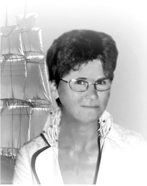
ТВОЙ НАПИШУ ПОРТРЕТ

Я на холсте тумана Твой напишу портрет. Знаю, судьба обманет – Есть ты, а вроде нет. В зыбком мареве раннем Вижу глаза твои, Верю – наше свиданье Скажет нам о любви. Но... Качнёт серебристый Полог ветер шальной, И в тополях ветвистых Образ растает твой. Я на холсте рассвета Твой напишу портрет, И середина лета Мне откроет секрет, – Где под тенью рябины На берегу реки Ждёт меня друг любимый, Судьбам всем вопреки.