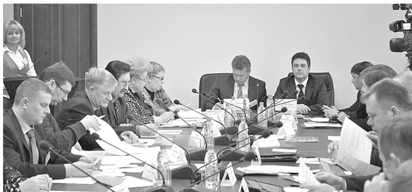
На заседании в Чайковский прибыли первые лица из 16 городов Прикамья.

внесении изменений и дополнений в Федеральный закон № 94-ФЗ «О размещении заказов на поставки товаров, выполненных работ, оказание услуг для государственных и муниципальных нужд», о разработке и реализации программ по обес-