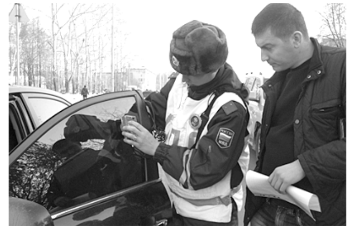
Во время рейда «Опасный водитель – Тонировка».