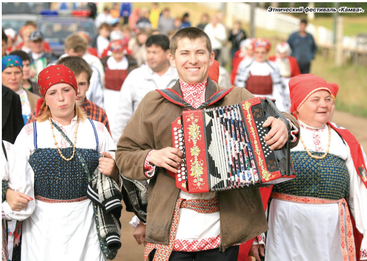
Этнический фестиваль «Камва».

Недавно обсуждали с коллегами в редакции свою национальную принадлежность и выяснили, что хоть большинство и считает себя русскими, но на самом деле кто на половину татарин, кто на четверть украинец, а кто – вообще целый букет кровей от предков получил. Это и понятно: Пермский край на протяжении нескольких столетий перемешивал людей совершенно разных национальностей и культур.