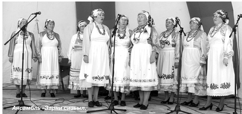
Ансамбль «Зарни сизылл».