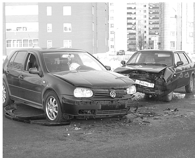
Дорожно-транспортное происшествие, произошедшее в «Завокзальном» микрорайоне.

Сотрудники ГИБДД обращаются ко всем участникам дорожного движения с просьбой неукоснительно соблюдать правила, быть предельно внимательными и проявлять взаимное уважение.