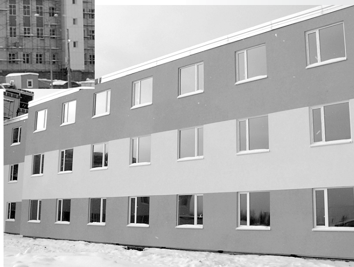
Бирюзово-песочный фасад отличает Пермский кардиоцентр от тех, что строятся в других регионах.

Краевой перинатальный центр рассчитан на 130 мест. В нем планируется вести наблюдение, диагностику, лечение и послеродовое сопровождение мам и новорожденных.