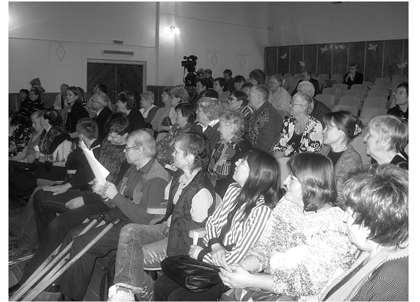
Делегаты из первичных организаций внимательно слушают кандидатов на пост председателя общества инвалидов.

Хочется отметить, что очень большая культурно-массовая работа и