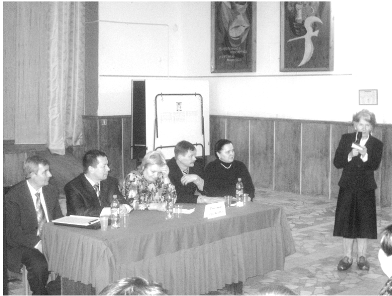
Рабочий президиум конференции.

– Большой вопрос – это обеспечение доступности к объектам социальной, транспортной и инженерной инфраструктуры. Наша организация участвовала в обследовании по доступности маломобильных групп населения к социально-значимым объектам, в рамках заказа проводимого Пермской краевой организацией ВОИ. Обследовано 13 объектов. Также разрабатывалась индивидуальная карта передвижения по маршруту от квартиры до конкретного объекта 10 инвалидов-колясочников. Результаты, мягко сказать, неутешительные, как по доступности объектов, так и по возможности передвижения по городу. Отрадно,