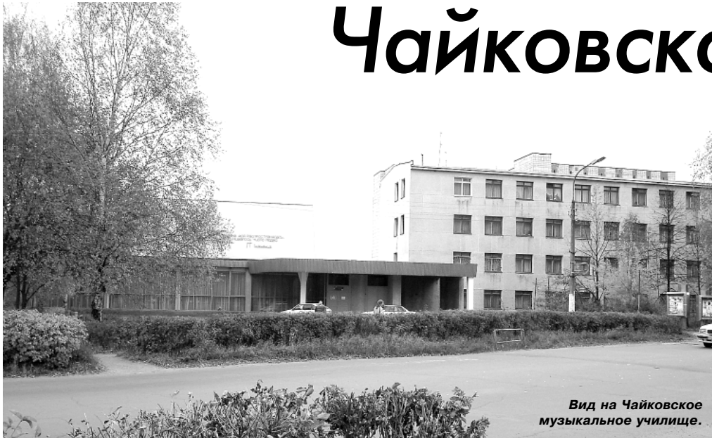
Вид на Чайковское музыкальное училище.