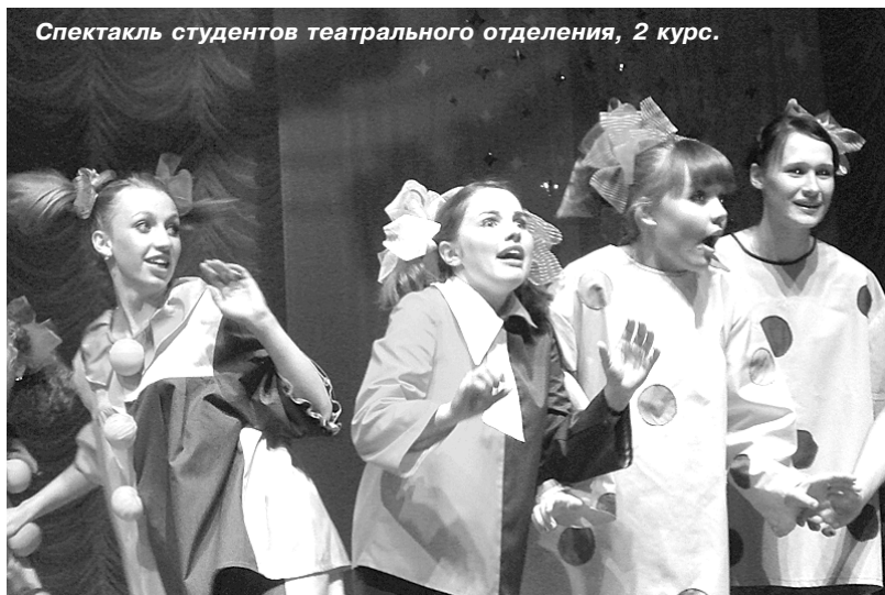
Спектакль студентов театрального отделения, 2 курс.