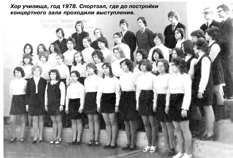
Хор училища, год 1978. Спортзал, где до постройки концертного зала проходили выступления.