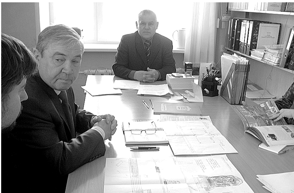
На очередном собрании обсуждается дальнейшая работа по строительству монумента.

Не за горами тот день, когда вся страна будет отмечать самое значимое событие – 65-ю годовщину Победы в Великой Отечественной войне. Каждый житель России знает, какой ценой она досталась. Из школьных учебников, художественных книг, из рассказов отцов и дедов мы знаем о безмерных страданиях и невосполнимых потерях, об огромном числе жертв и бесчисленных лишениях, которые принесла самая кровопролитная за всю историю человечества война. И нет ни одной семьи, которую бы не коснулась эта всеобщая беда.