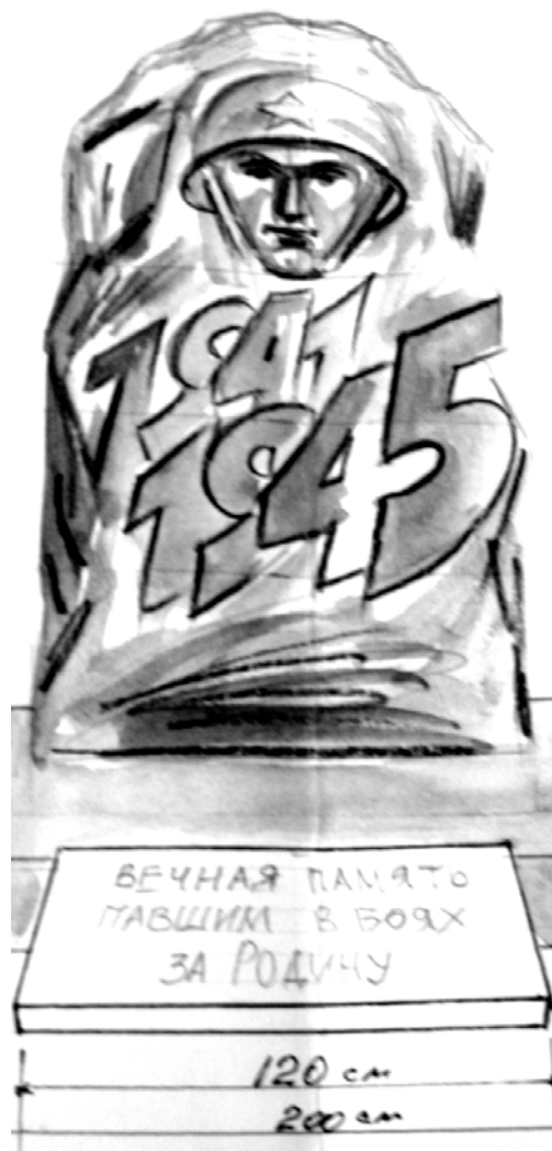
Обелиск Памяти пока на эскизе.

Всем, кто захочет внести свой вклад в благородное дело, сообщаем расчетный счет: