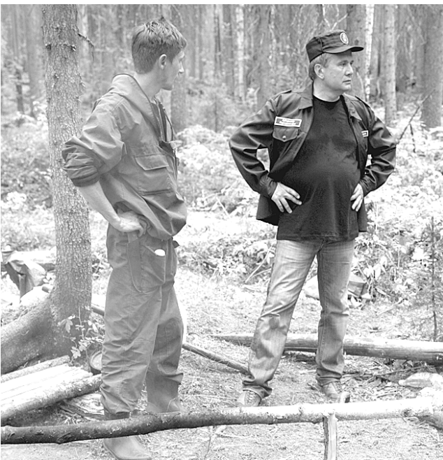
Губернатор Олег Чиркунов лично выехал в Гайнский район, чтобы на месте оценить ситуацию с лесными пожарами.

Экстренные службы готовы отразить натиск огня: на борьбу со стихией брошены все силы и средства