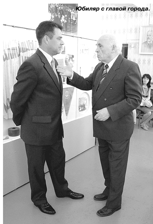
Юбиляр с главой города.