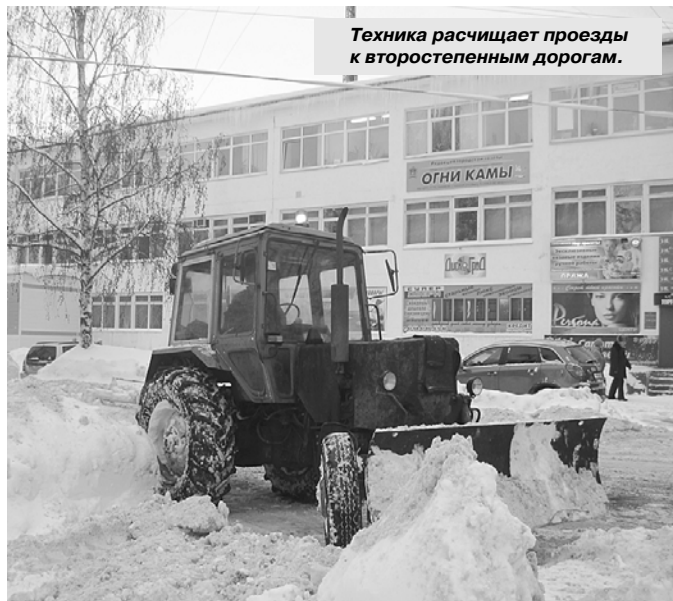
Техника расчищает проезды в второстепенным дорогам.

Вопрос, оставшийся без внятного ответа еще с прошлой зимы: почему не вывозится снег с улиц города? Нам отвечали, что нет на это ни техники, ни средств