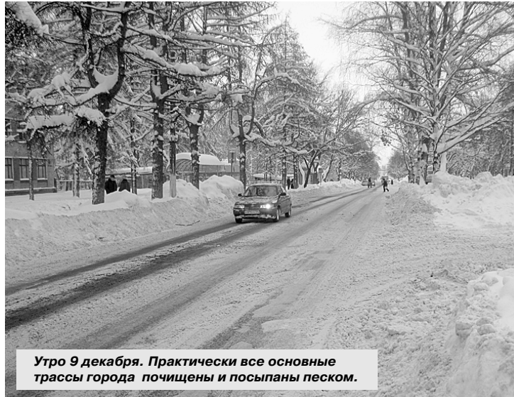
Утро 9 декабря. Практически все основные трассы города почищены и посыпаны песком.

Своей непредсказуемостью погода уже не в первый раз ставит нас в тупик. Начавшись в субботу 4 декабря, сильнейший снегопад продолжался три дня! И в понедельник утром многим горожанам пришлось добираться на работу в сложных условиях. По центральным дорогам двигалась снегоуборочная техника, что тоже тормозило движение автотранспорта. И все это на фоне непрекращающегося снегопада.