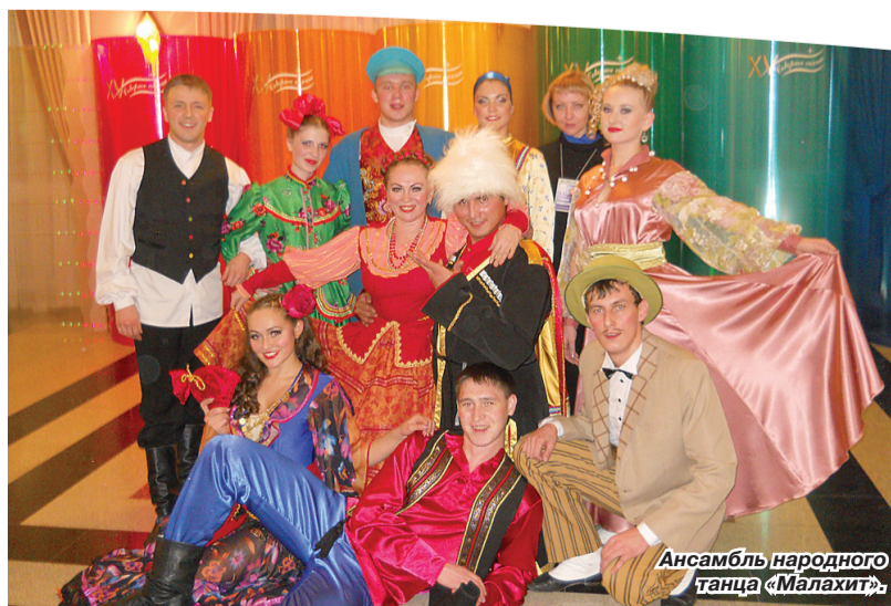
Ансамбль народного танца «Малахит».