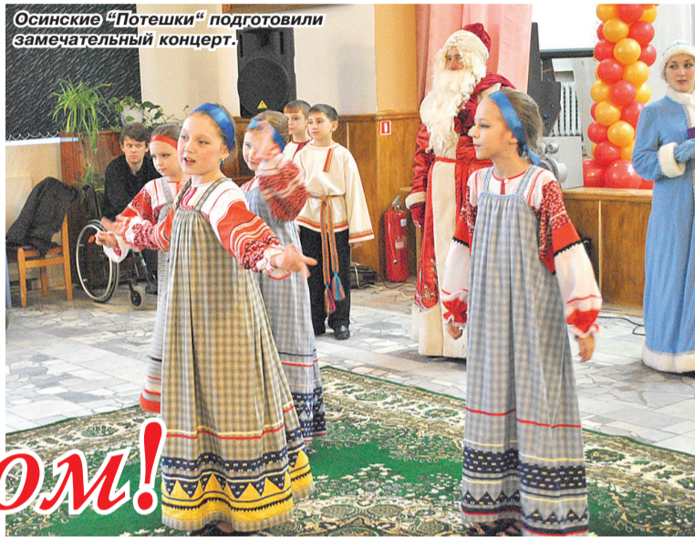
Осинские «Потешки» подготовили замечательный концерт.