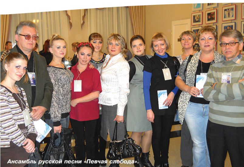
Ансамбль русской песни «Певчая слобода».