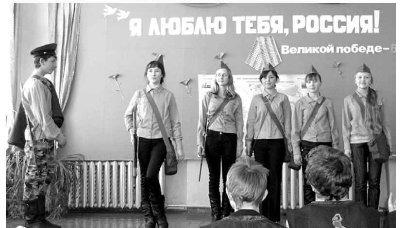
Фестиваль патриотической песни в с. Вассята.

А что сегодня? В последние годы патриотическому воспитанию уделялось очень мало внимания, в связи с чем мы «потеряли» целое поколение молодых людей. Сейчас спохвати-