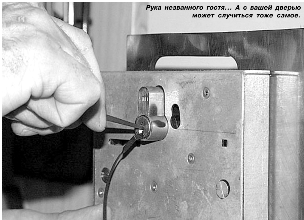
Рука нежданного гостя... А с вашей дверью может случиться тоже самое.