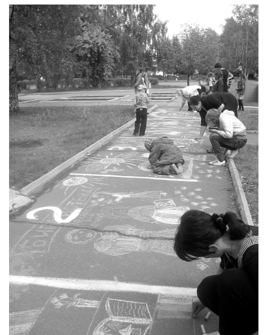
Конкурс рисунков на асфальте на площади искусств.