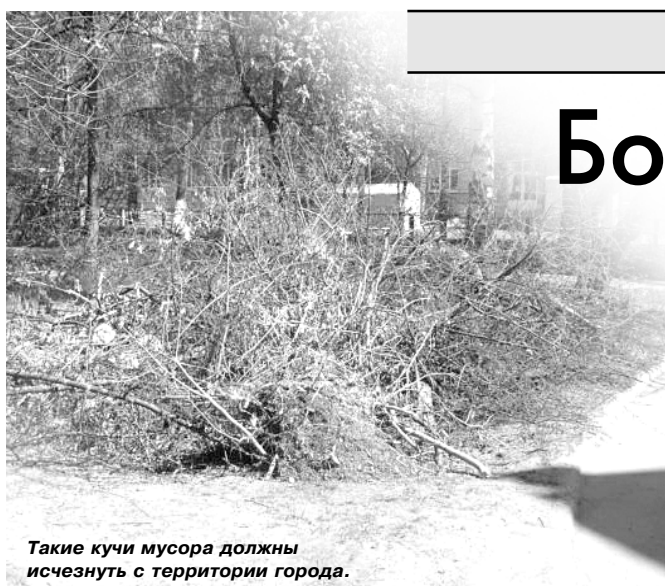
Такие кучи мусора должны исчезнуть с территории города.