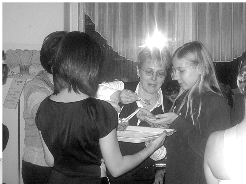
Слепить русские пельмени гостям из Германии оказалось под силу!

тинной галереи, урок фольклора в архитектурно-этнографическом комплексе «Сайгатка», мастер-классы по декоративно-прикладному творчеству в гимназии, экскурсии на ГЭС и завод газовой аппаратуры, посещение НОЦа и уроков в гимназии – все это, по признанию наших гостей, было настолько интересным, увлекательным и познавательным, что на осмысление увиденного уйдет не один день. «Программа пребывания в Чайковском была настолько насыщенной, что ни поговорить, ни обсудить уви-