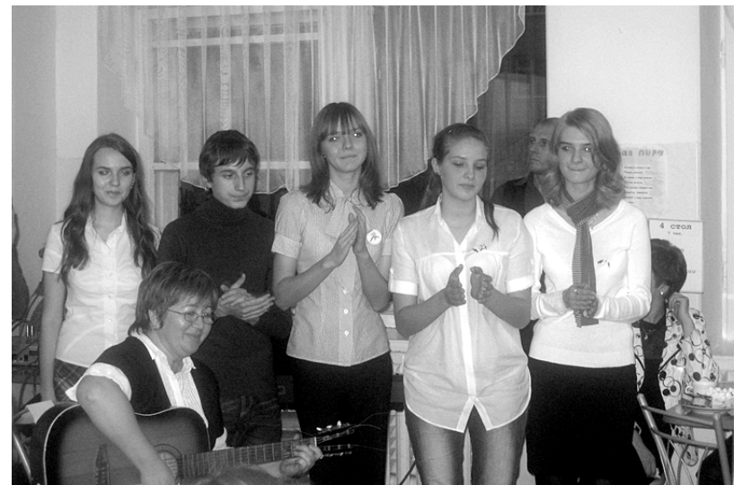
Эти чайковские школьники посетили Нойштрелитц в прошлом году.

Делегация из немецких школьников и преподавателей посетила Чайковский.