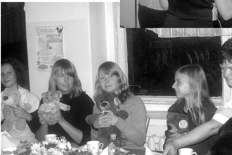
Плюшевые мишки как символ нашего города – в подарок немецким школьницам.