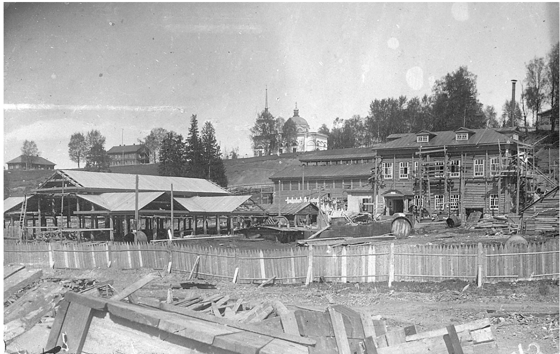
Вид на храм (в центре вдаль) со стороны завода.

имея готовый проект церкви, просил Владыку получить разрешение Св. Синода на строительство. 27 сентября Преосвященный письмом в Синод изложил мотивы для положительного решения вопроса: храмоздатель выстроит каменный храм, закажет для него иконостас, колокола, богослужебные книги и утварь. Обязуется содержать на свой счёт священника с причетниками.