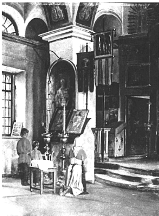
А. Сведомский. В местной церкви.