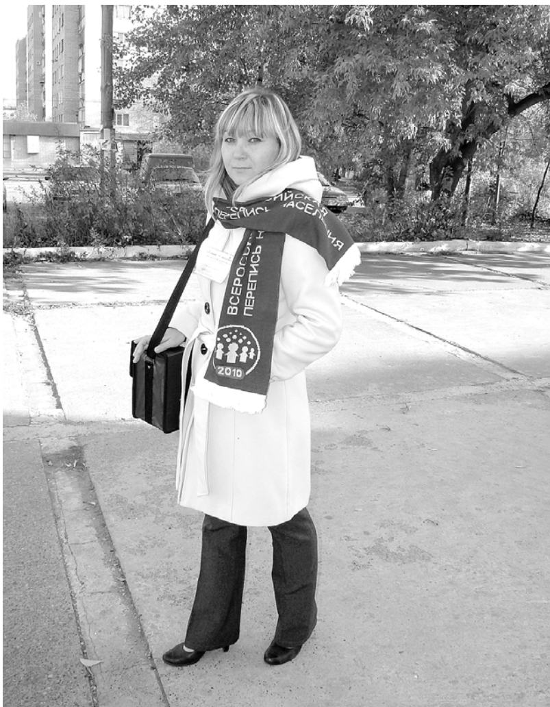
Переписной чемоданчик, шарф с эмблемой Всероссийской переписи населения и удостоверение позволят гражданам не перепутать переписчика с мошенником.

держит вопросы о жилищных условиях населения (тип жилого помещения, время постройки дома, материал наружных стен, размер общей площади, количество жилых комнат, виды благоустройства).