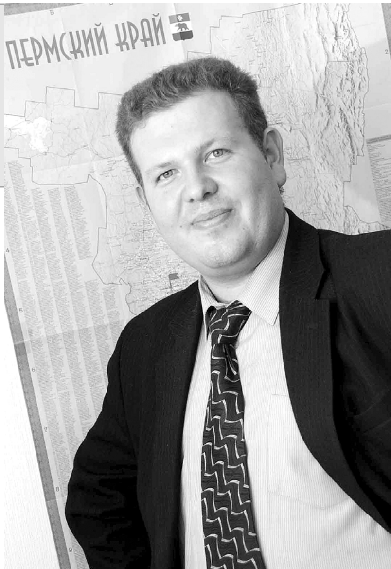
Сейчас кадры, которые выпускает наша фармакадемия, одни из лучших в отрасли.

– Цель одна – здоровье людей. Сегодня традиционная и народная медицина идут рука об руку. В состав популярных лекарств все чаще включают растительные компоненты. К сожалению, у нас