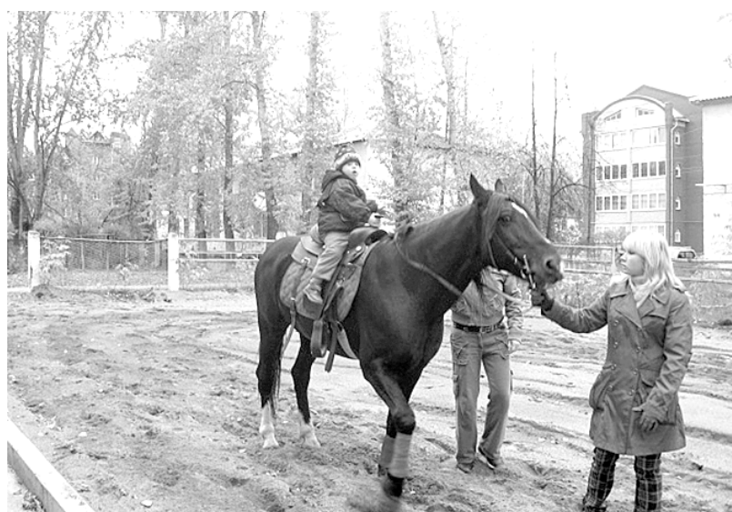
Лечебная верховая езда – это не только полезно, но и очень интересно!

На совещании рабочей группы по реализации проекта был составлен примерный график экскурсий и мероприятий, планируемых в музее в сентябре-октябре 2010 года для учащихся образовательных учреждений, подростков, находящихся в социально опасном положении, состоящих на учете комиссии по делам несовершеннолетних.