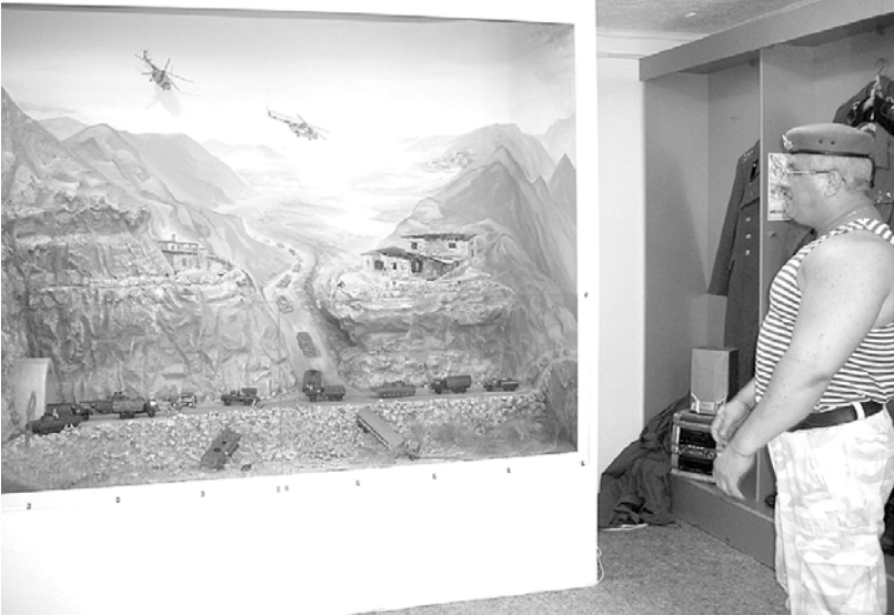
Панорама «реального боя» завораживает...

В ходе реализации проекта были созданы условия для сохранения и поддержания традиции живого (личного) общения ветеранов с подрастающим поколением в реконструированном музее Памяти. На сегодня проведено уже 4 военно-патриотических мероприятия, в которых приняли участие более 1000 человек.