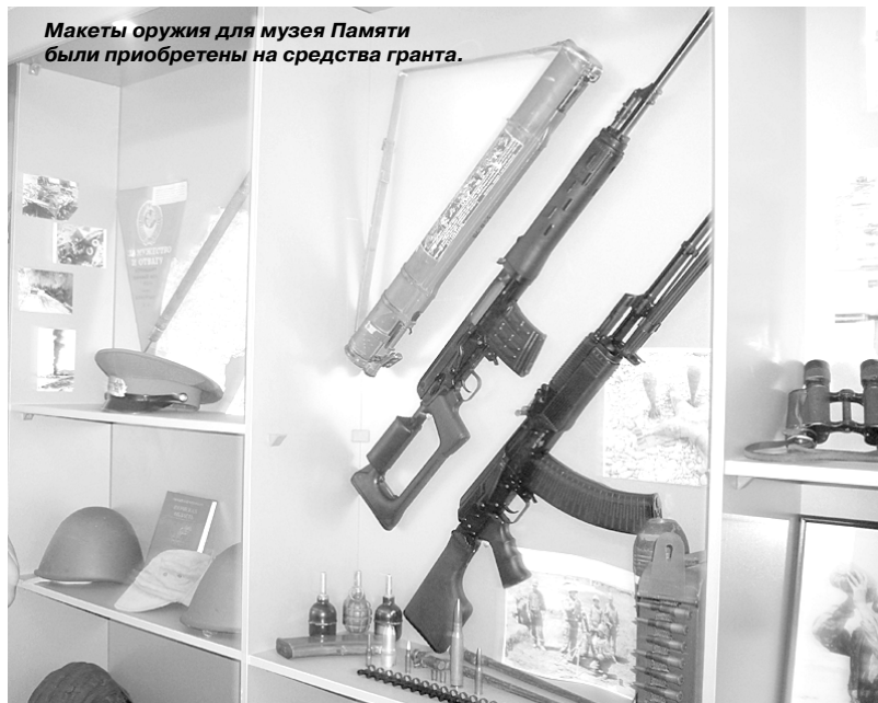
Макеты оружия для музея Памяти были приобретены на средства гранта.

Основной направленностью проекта является создание условий для проведения иппотерапии. Лечебная верховая езда способствует улучшению общего состояния организма, благотворно влияет на опорно-двигательный аппарат, дает возможность ребенку с особыми потребностями обрести уверенность в себе.