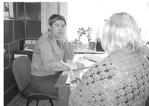
Встреча инспектора ПДН ОВД по Чайковскому муниципальному району с родителями.