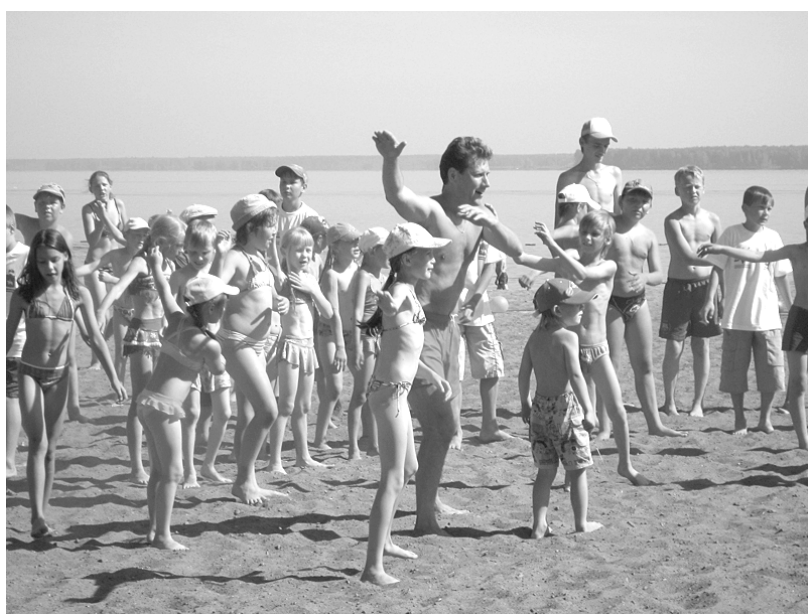
Солнце, воздух и вода – наши лучшие друзья!