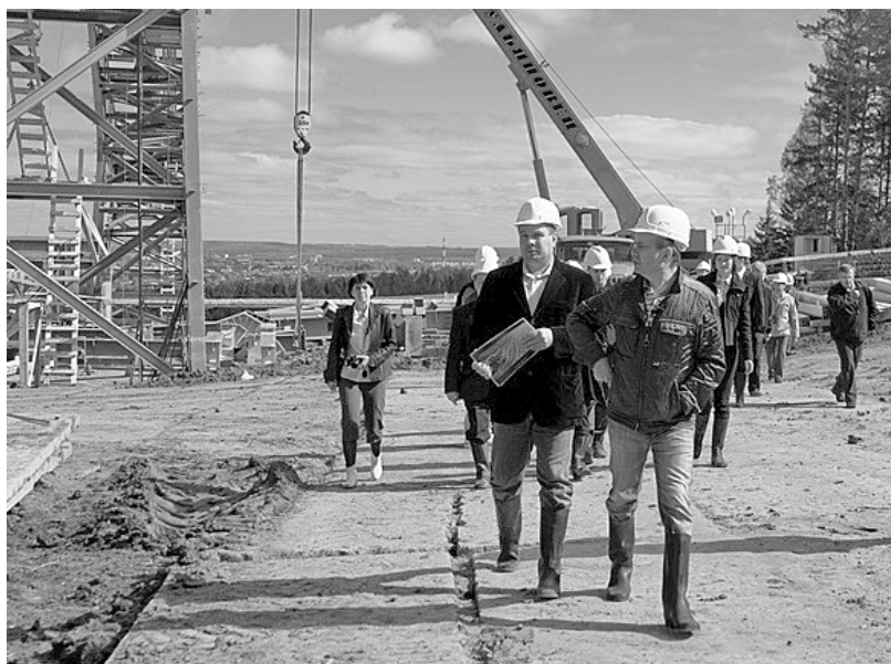
Губернатор Олег Чиркунов, надев сапоги, вместе со строителями обошел всю территорию горнолыжного комплекса

После «Снежинки» губернатор отправился на биатлонный комплекс, строительство которого находится в завершающей стадии. Практически готов хозяйственно-бытовой корпус, где осталось довести до конца отделку, испытать внутренние инженерные сети. Строители уже приступили к благоустройству вокруг корпуса, идет реконструкция пруда под искусственное снежное покрытие. С верхней площадки Олег Чиркунов