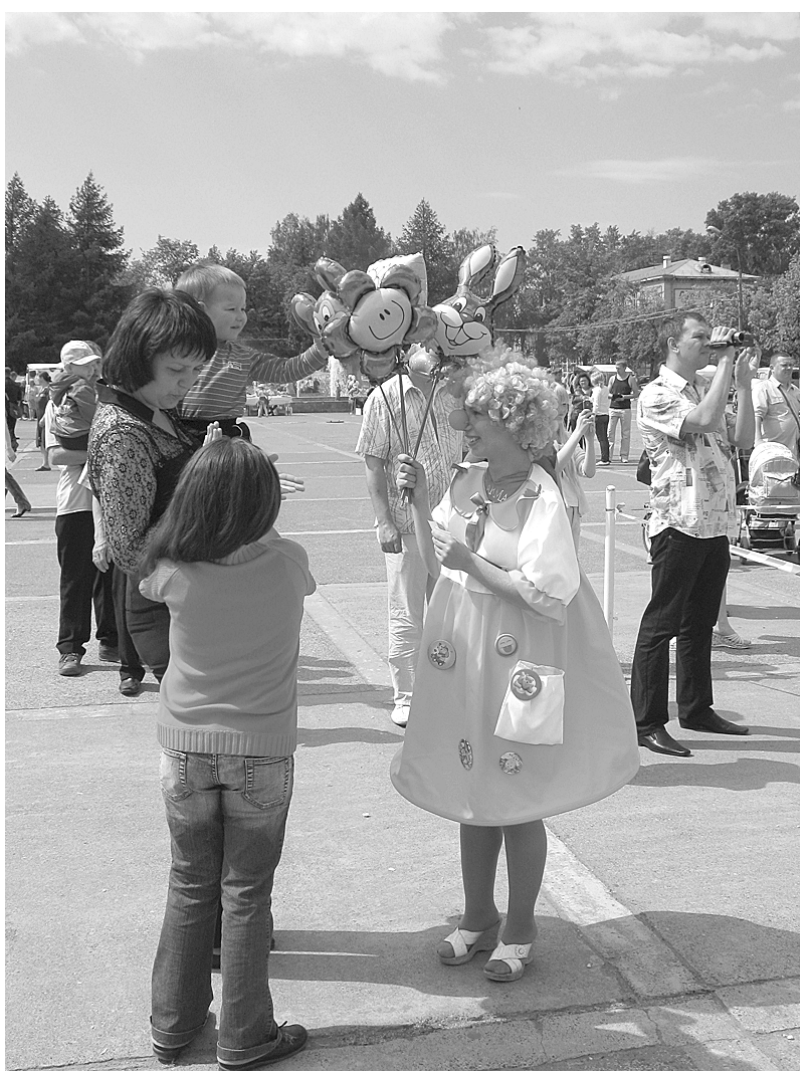
И в городе тоже было весело!

– Источниками финансирования летней кампании являлись средства краевого и местного бюджетов, средства предприятий и родителей. Из регионального фонда нашей территории была направлена субвенция в размере 11 млн. 362 тысячи рублей. Значительная часть этих средств распределена на оплату питания в лагерях с дневным пребыванием, приобретение путевок в загородные лагеря для детей работ-