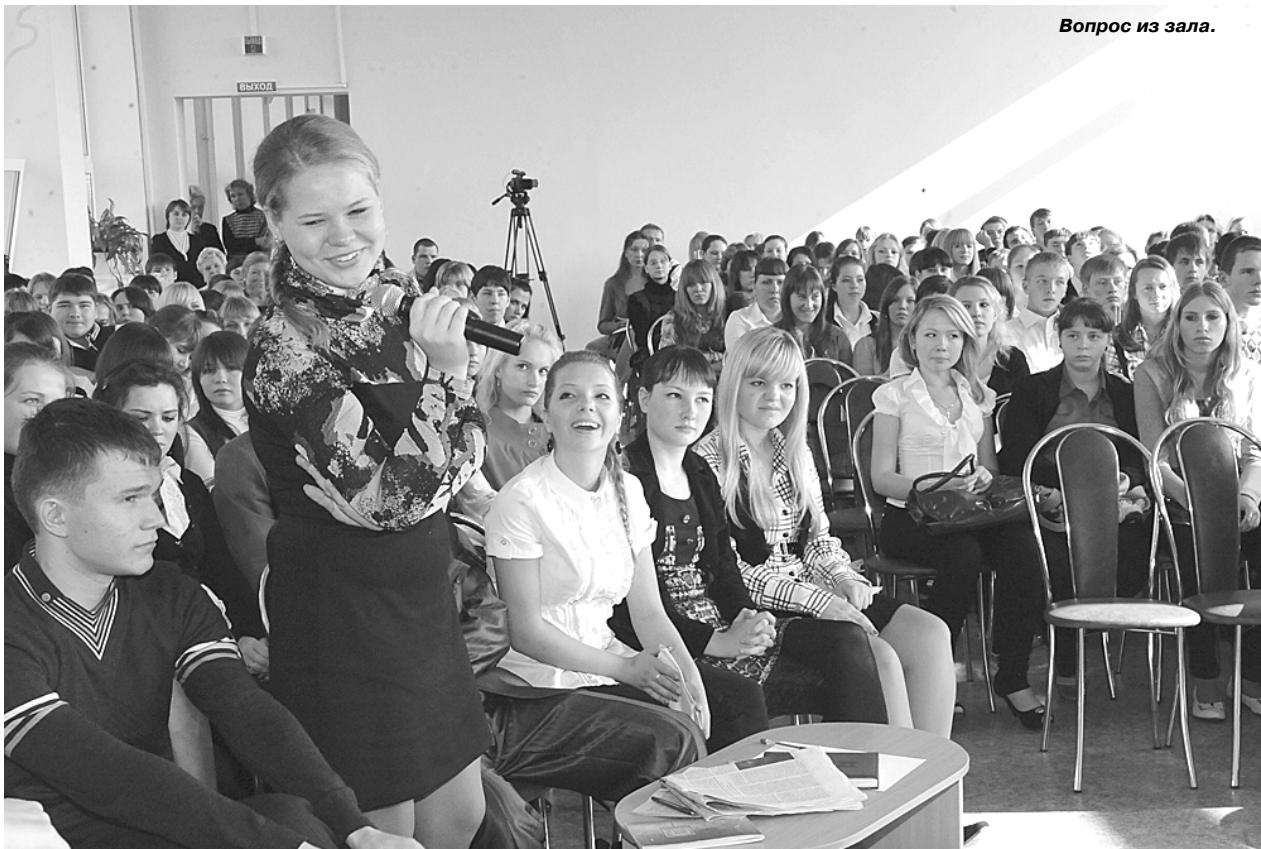
Вопрос из зала.