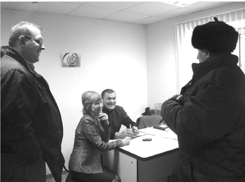
В офисе компании «ТеплоВодоМер» каждого посетителя встречают с улыбкой.

До последнего времени на обслуживании у ООО «ТеплоВодоМер» числилось десять многоквартирных домов. Осенью 2009 года жилой фонд этой компании увеличился в три раза. В последних числах августа и первой декаде сентября сотрудники ООО «ТеплоВо-