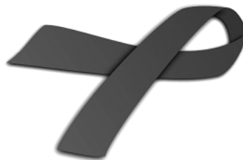
Красная ленточка – символ борьбы со СПИДом.