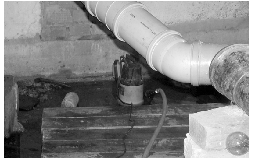
Насос в подвале – неперенный атрибут работы сантехников.

В офисе компании многолюдно. Сюда приходят жильцы домов, здесь собираются заявки и распределяется фронт работ. А работа кипит! За последнюю неделю от жителей домов поступило тридцать шесть заявок на электромонтажные работы и пятьдесят на сантехнические. Чтобы не быть голословными, приведем несколько примеров: в доме № 48 по улице К. Маркса заменены тридцать