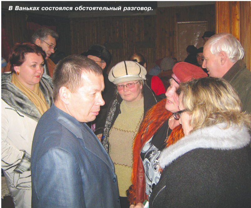
В Ваньках состоялся обстоятельный разговор.

В своем выступлении специалист земельного комитета напомнила селянам, что необходимо оформлять документы на землю под теми домами, в которых они живут. У рачительного хозяина должно быть два свидетельства: