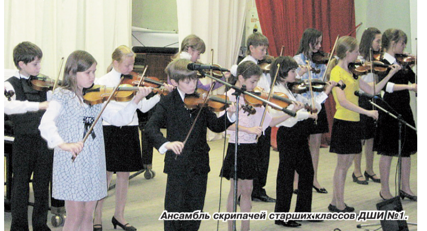
Ансамбль скрипачей старших классов ДШИ №1.