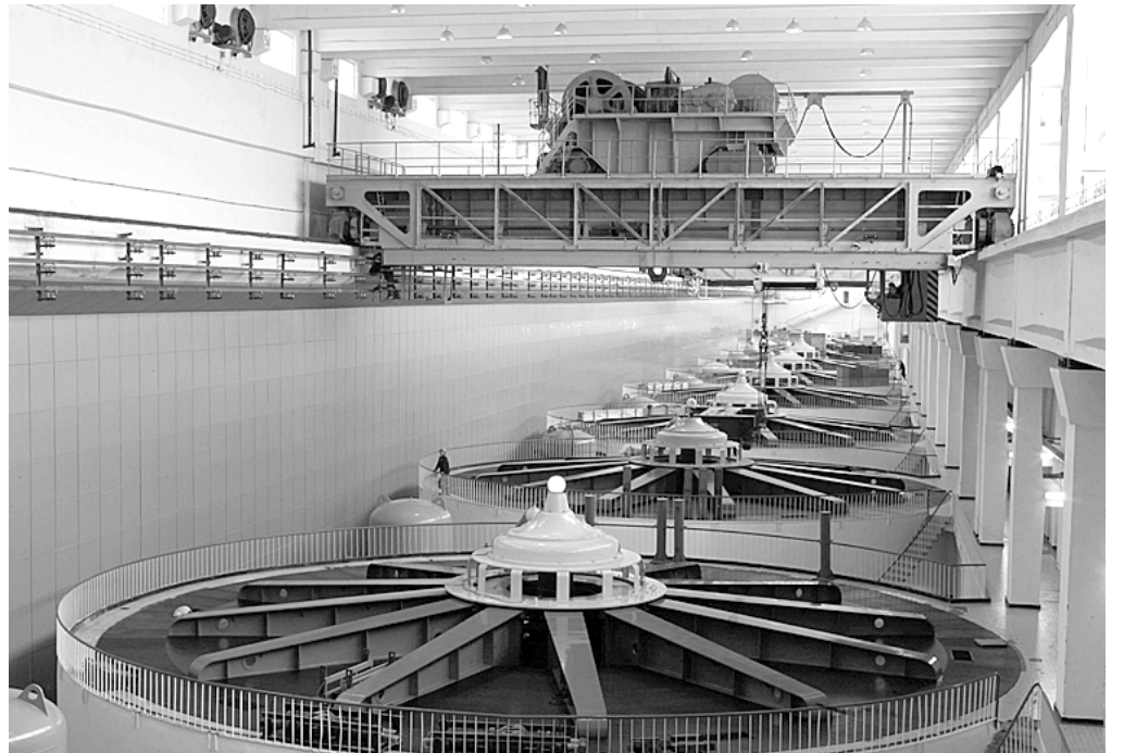
Работы в машинном зале ВотГЭС идут по плану.