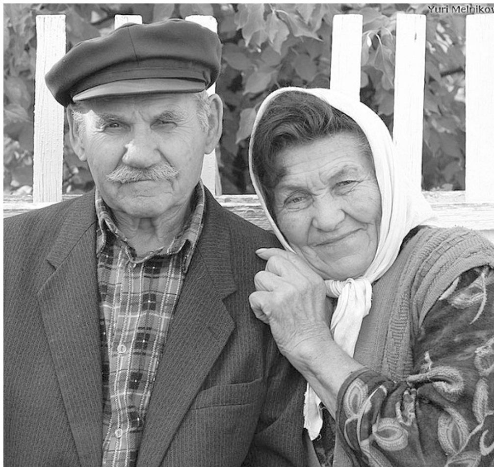
Выплаты компенсаций на оплату коммунальных услуг начнутся уже в конце декабря.

С января 2010 года в Пермском крае изменится форма и порядок оплаты за жилищно-коммунальные услуги. Реформирование льготной системы обеспечит получение денежной компенсации каждому ветерану труда, независимо от того, проживает ли он в городе с развитой коммунальной инфраструктурой или в деревне, лишённой благ цивилизации.