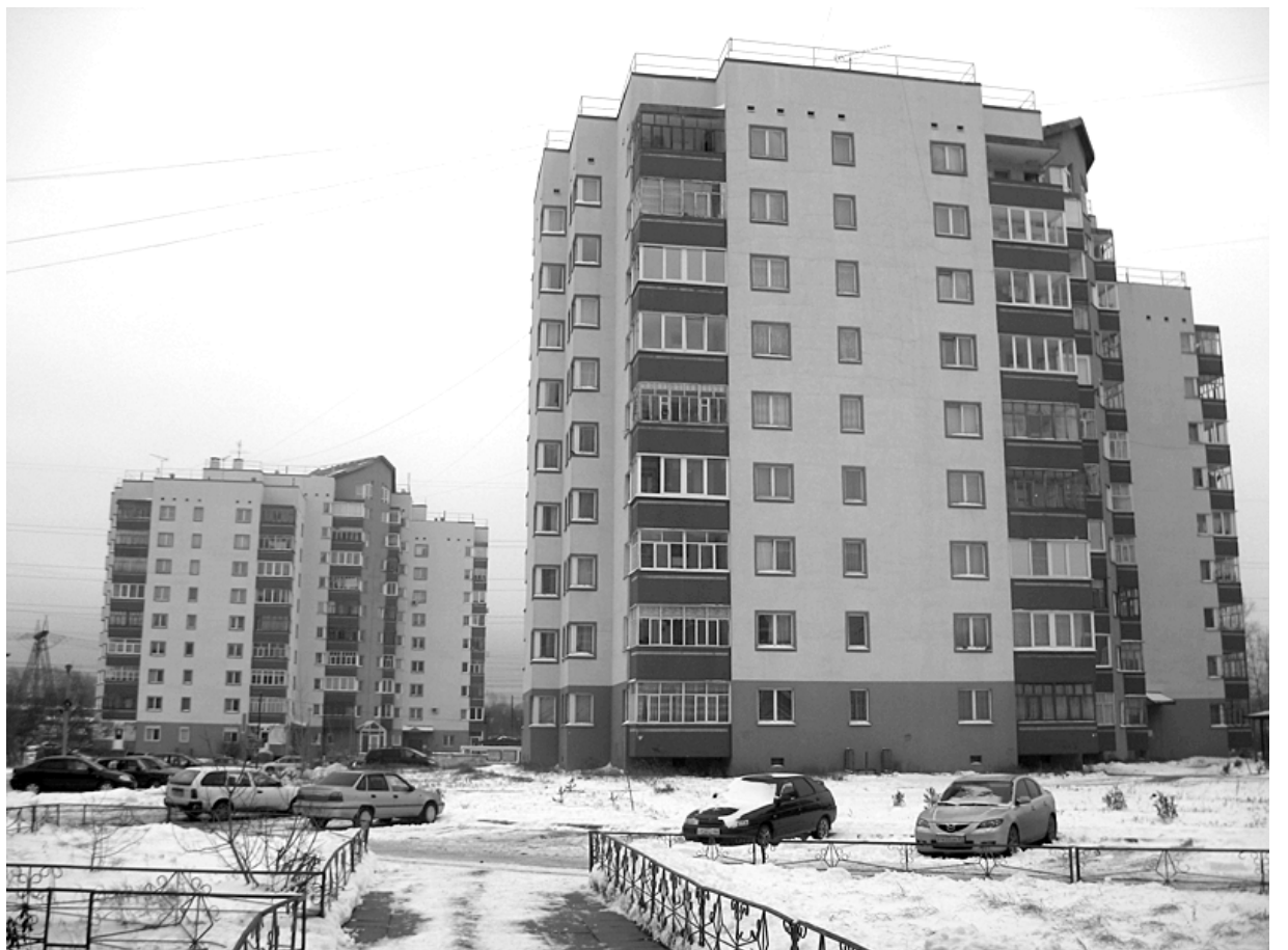
В ТСЖ «Азинский» не знают проблем с оплатой ГВС.