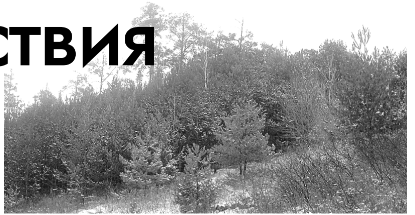
Обратите внимание на верхушки этих деревьев, растущих возле городской свалки. Засохшие вершины их указывают на то, что они больны раком.

Человек привык относиться к окружающей его природе потребительски, с унижающим невниманием. Стремление только брать и ничего не отдавать взамен привело к тому, что наши леса находятся в крайнем запущении, горы бытового мусора давно перебрались за черту городских поселений и прочно обосновались на лесных полянках. Кроме того, некоторые «дельцы от природы» незаконно вырубают целые гектары леса, нанося невосполнимый урон зеленым насаждениям.