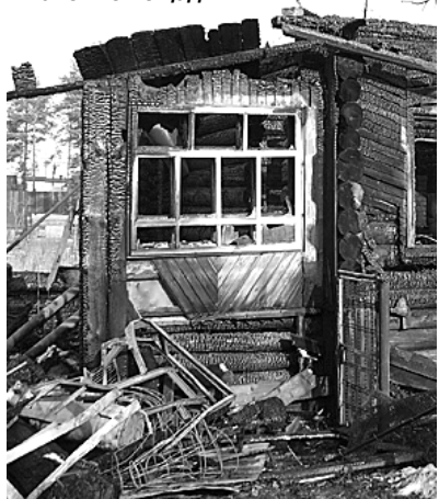
Пожар на Вишневой мало что пощадил.

Судя по цифрам, количество пожаров, произошедших в этом году на нашей территории, несколько снизилось: в 2008 году на данный период их было зарегистрировано 103, а в нынешнем, напомним, – 99. Меньшим оказался и ущерб, нанесенный огнем: в 2008 году он составил почти 3 миллиона рублей, ныне – чуть больше одного миллиона. Однако успокаиваться нет причин. Только бдительность, осторожность и внимательность смогут уберечь вас от бед и чрезвычайных ситуаций. Помните: огонь не терпит шалости и халатного к нему отношения.