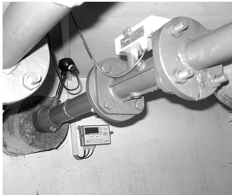
Такая грамотная установка приборов учёта тепла позволит горожанам не переплачивать за коммунальные услуги.