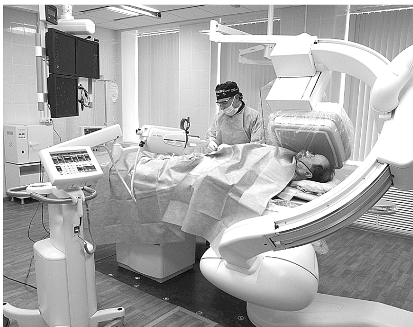
Новый ангиограф поможет «сердечным» врачам спасти сотни человеческих жизней.

Пермский край по уровню обеспеченности населения кардиохирургической помощью – на первом месте в России. А благодаря новому ангиографу институт в два раза увеличит возможности по диагностике пациентов.