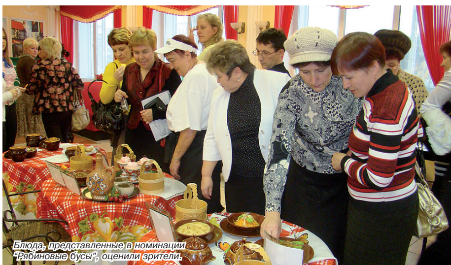
Блюда, представленные в номинации «Рябиновые бусы», оценили зрители.

Впрочем, первый же день фестиваля показал, что повара Прикамья есть на кого равняться. Это был самый насыщенный этап соревнований. Прежде всего потому, что в этот день представлялись кулинарные творения в самой многочисленной номинации – «АРТ-класс». Фуршетные закуски мясные и рыбные, национальные блюда, изделия из шоколада, мастики, марципана и теста, панно и картины из крупы – было где разгуляться фантазии повара. И даже у самых сытых зрителей от такого разнообразия красиво оформленных и (не сомневаем-