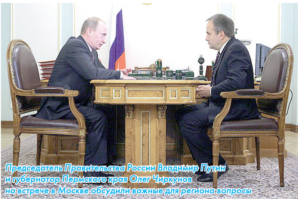
Председатель Правительства России Владимир Путин и губернатор Пермского края Олег Чиркунов на встрече в Москве обсудили важные для региона вопросы

обретет в Перми 1080 квартир для семей военнослужащих. Программа разбита на два этапа. На первом этапе в 2009-2010 годах будет куплена половина жилья, а это 540 квартир, столько же будет приобретено и в 2011-2012 годах.