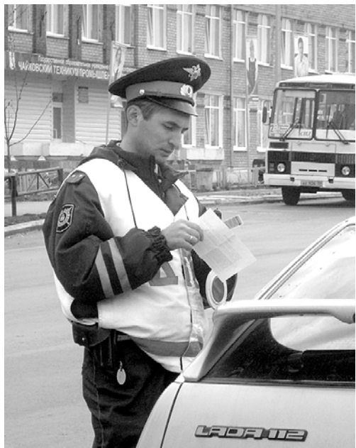
Инспекторы ДПС несут службу на ул. Вокзальной – одной из самых оживленных в городе.

Начальник ОВД отметил, что в общей структуре преступности продолжают доминировать имущественные преступления: 1164 факта в этом году, что на 405 случаев меньше. Приятной оказалась информация о том, что произошло снижение квартирных краж – с 77 до 72, разбойных нападений – с 30 до 19, грабежей – с 304 до 216. Все это позволяет говорить об эффективности правоохранительных органов по профилактике и выявлению преступлений.