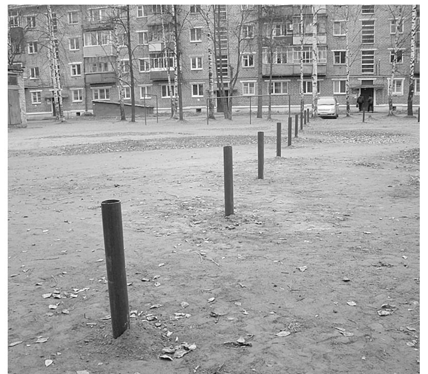
Детская площадка скоро будет надежно защищена от автомобилей.